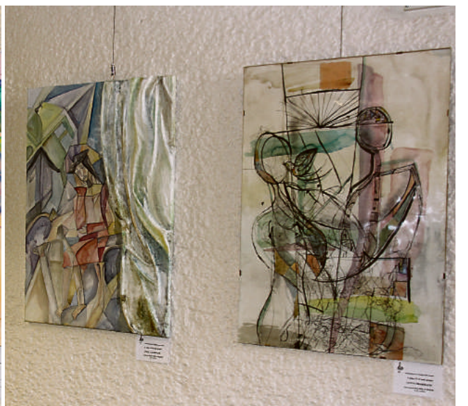
VI-ojo Tarptautinio vaikų ir jaunimo dailės konkurso-festivalio „Čiurlionio krašto spalvos“ dalyvių darbų ekspozicijos fragmentas

Tešiant gražią tradiciją, Druskininkų savivaldybės administracijos pastato Vasario 16-osios g. 7 antrojo aukšto fojė eksponuojami jaunųjų dailininkų darbai. Tai Druskininkų M. K. Čiurlionio meno mokyklos V. K. Jonyno dailės