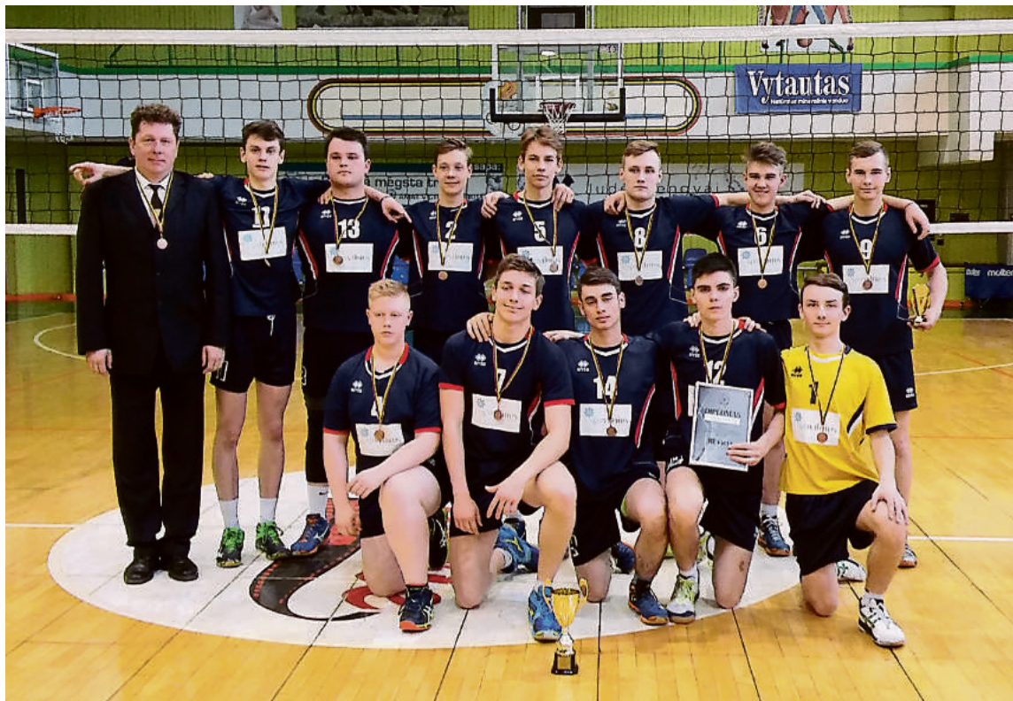
Jaunieji tinklininkai didžiuojasi savo pasiekimais