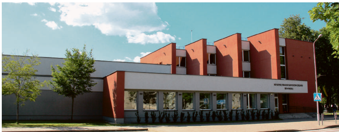
Šiemet prasidėsiantys mokyklos vidaus patalpų atnaujinimo darbai, pagal projektą „Druskininkų M. K. Čiurlionio meno mokyklos infrastruktūros tobulinimas“, numatomi baigti 2018 metais

Druskininkų M. K. Čiurlionio meno mokyklos muzikos skyriaus auklėtiniai, čia dirbantis personalas ir mokytojai jau spėjo įvertinti prieš trejus metus mokykloje atliktos renovacijos rezultatus.