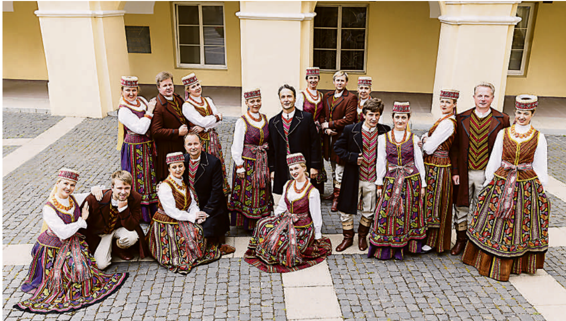
Liepos 1 dieną Druskininkuose prasideda tarptautinis menų festivalis „Druskininkų vasara su M. K. Čiurlioniu 2017“. Pradžios koncerte dalyvaus ir valstybinis dainų ir šokių ansamblis „Lietuva“