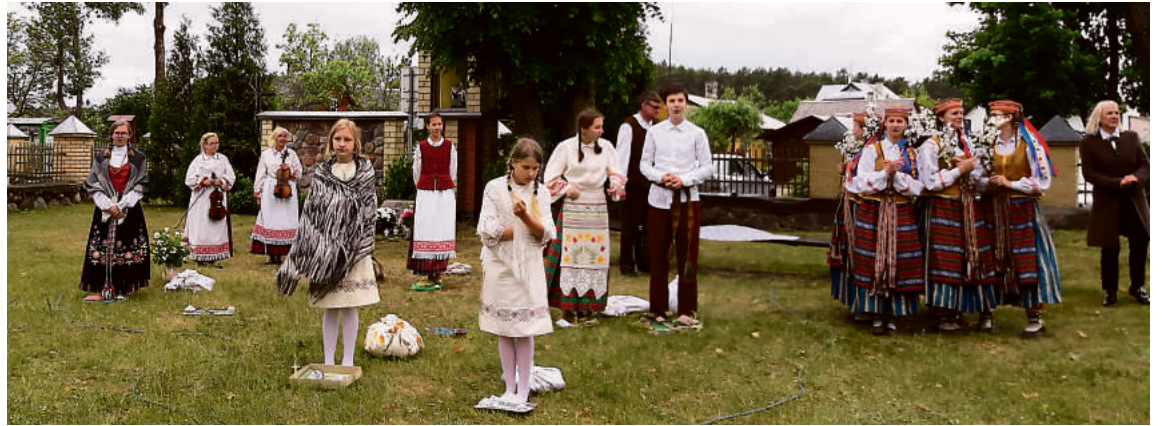
Birželio 14-ąją, minint Gedulo ir vilties dieną, kompozicijoje „Palikti namai“ mokinių lūpomis išsakyti skaudūs tremtinių prisiminimai aidėjo Ratnyčios bažnyčios šventoriuje