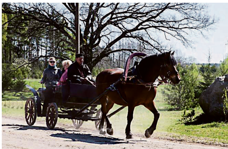
Norima, kad savivaldybės ir regionai įsitrauktų į lenktynes dėl investicijų, žmonių

Parengta pagal Robertos Tracevičiūtės straipsnį, publikuotą Lietuvos žiniuose ir portale www.lzinios.lt 2017 m. birželio 22 dieną