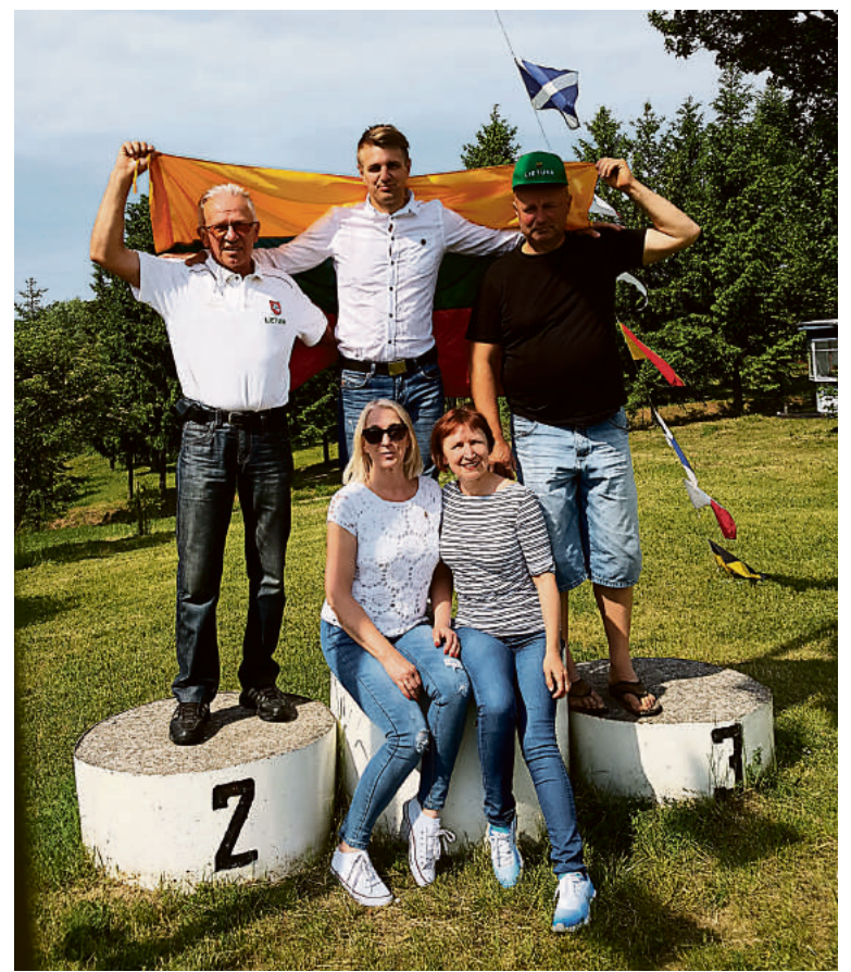
„Atgimimo“ mokyklos mokytojų komanda puikiai pasirodė tarptautinėje Vandens spartakiadoje Lenkijoje, Giżycko mieste