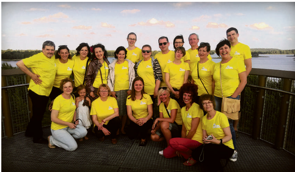
Ceremonijoje „Gėlės Čiurlioniu“ (prie paminklo V. Kudirkos gatvėje) dalyvaus mišrus choras „Druskininkai“