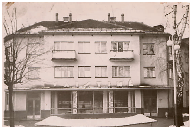
Į šią vaistinę žmonės užsukdavo ne tik vaistų, bet ir konsultacijos, patarimo, gero žodžio

– Būdavo ir smagių, ir visai linksmą papasakosiu. Yra toks šunvyšnės ekstraktas. Jo dažnai prašydavo turistai. Kartą užėjęs į vaistinę žmogus paprašė ekstraktą per pusę sumaišyti su soda. Vaistinėms, jaunas farmakoteknikas, nepatyręs, – padarė, ko prašomas. Tačiau, maišydamas preparatus, norma viršijo keliasdešimt kartų. Žmogus stipriai apsinuodijo, tačiau, praplovus skrandį, nelaimės išvengta.