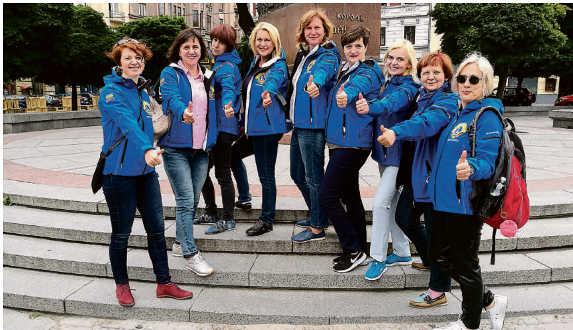
Druskininkų „Lions“: „Dėkojame visiems geros valios žmonėms, bendruomenės nariams, kad per dešimtį klubo veiklos metų prisidėjote prie mūsų pagrindinės misijos – suteikti pagalbą tiems, kuriems tuo metu jos labai reikia“

Profesionalus komedijos teatras www.dominoiteatras.lt