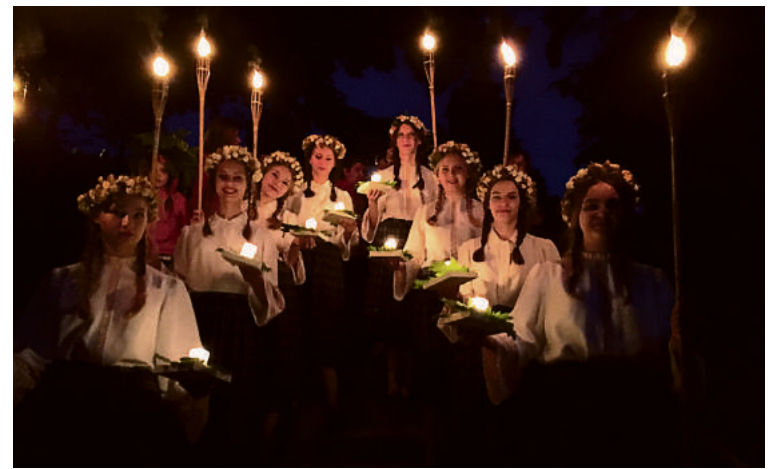
Į naktines paparčio žiedo paieškas ir žolynų plukdymo Nemunu ceremoniją lydėjo studijos „Opus“ šokėjos

Visos šventės metu savo pasirodymais džiugino šiuolaikinio šokių studija „Opus“, liaudiškos muzikos kapela „Vieciūnai“, folkloro ansamblis „Stadalėlė“, muzikos grupė „4fun“.