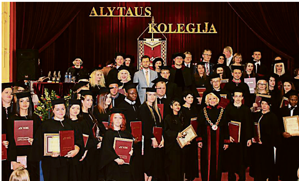
Alytaus kolegijos Druskininkų grupėse mokosi įvairaus amžiaus studentai

Alytaus kolegija, tęsdama tradiciją, organizuoja aukštojo mokslo studijas Druskininkuose.