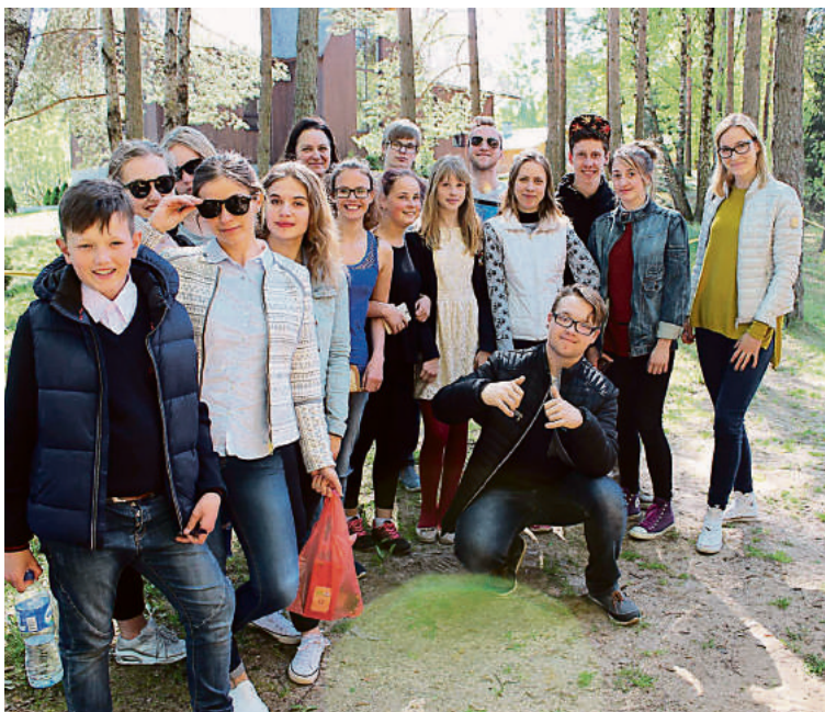
Jaunimo užimtumo centro komanda kviečia jaunuolius jungtis prie projekto „Psicholmuno“, sekti veiklas ir aktyviai jose dalyvauti

Televizija, laikraščiai, internetas – kasdien pateikia pasiūlymų kaip turi atrodyti, kalbėti, ką turi daryti! Stereotipai verčia elgtis ne pagal save, kopijuoti, bandyti pritaipyti. Mes norime, kad tu mokėtum atsiirinti informaciją ir nedarytum to ko neprivalai – įtikti visiems. Mes norime tavęs tvirtu ir pasitikinčiu savimi, nebijančiu būti savimi!