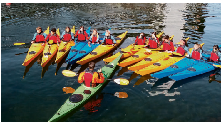
Kelionė į Bergeną, vieną gražiausių Norvegijos miestų, esančią mokyklą „Atgimimo“ mokyklos mokytojams ir mokiniams paliko neišdildomus įspūdžius.

Vietoj daugelio knygų, kurias mes turime nešiotis kiekvieną dieną, jie naudojami asmeniniais nešiojamais kompiuteriais. Ši naujovė mūsų mokyklose, manau, tikrai palengvintų daugelio mokinių kasdienybę.