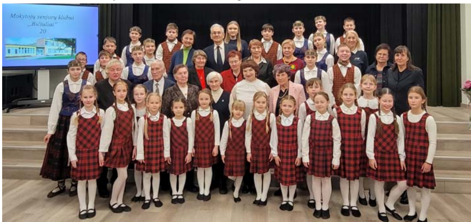
„Atgimimo“ mokyklos aktų salėje surengta klubo „Bičiuliai“ 20-mečiui skirta šventė

2026-ųjų vasario 25-ąją „Atgimimo“ mokyklos aktų salėje surengta klubo 20-mečiui skirta šventė. Jaunųjų šokėjų ansamblis „Druskutis“, vadovaujamas