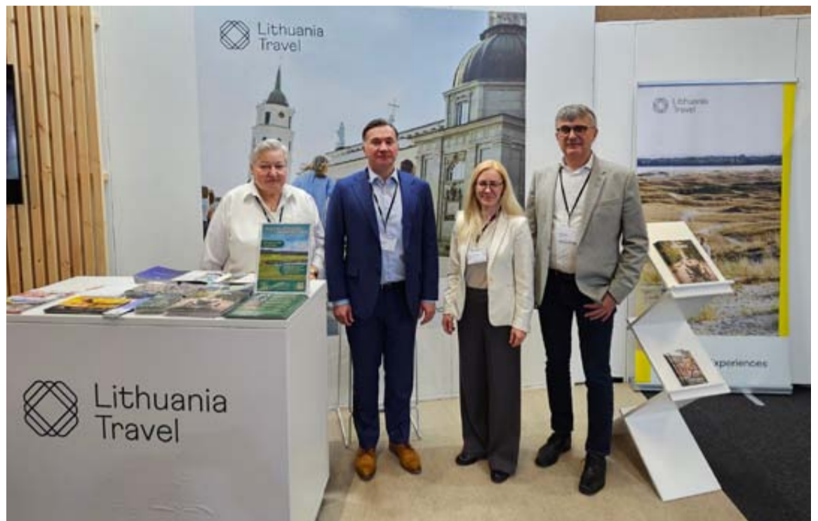
Druskininkų pristatymas Skandinavijos regiono auditorijai kartu su LR ambasada Danijoje ir „Keliauk Lietuvoje“

Druskininkų stendas tapo susitikimų ir pokalbių erdve mugės lankytojams: čia buvo galima ne tik susipažinti su kurorto naujienomis, renginiais ir turizmo pasiūlymais, bet ir pavartyti bei įsigyti leidinių, pasakojančių Druskininkų istorijas. Šių metų