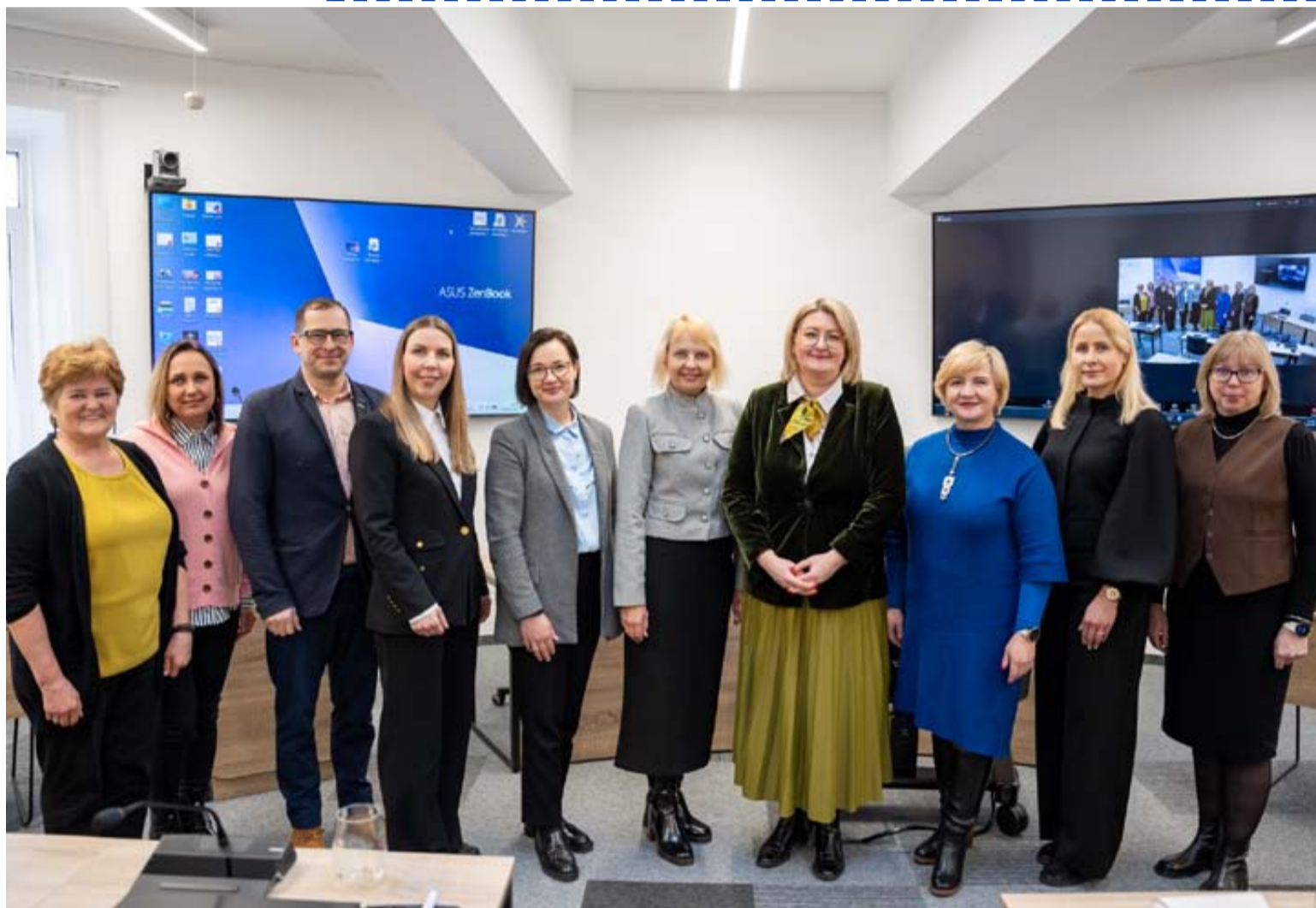
Šeimos komisija patvirtino 2026 metų komisijos veiklos planą, numatantį konkrečias iniciatyvas šeimų stiprinimui

Šeimos komisija – tai savivaldybėje veikianti komisija, kurios užduotis – įsiklausyti į šeimų problemas ir ieškoti sprendimų, kaip savivaldybė galėtų joms padėti. Komisija dirba tam, kad šeimų klausimai būtų sprendžiami ne pavieniui, o koordinuotai, bendradarbiaujant skirtingoms sritims.