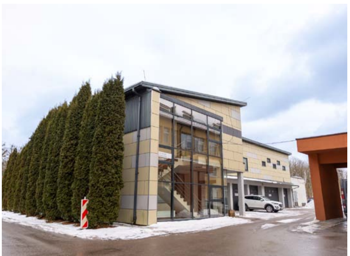
Buvusio GMP pastate jau šiemet duris atvers naujas akušerio ginekologo kabinetas su echoskopu

Patalpų remontui ir įrangos įsigijimui projekte numatyta 70 tūkst. Eur lėšų.