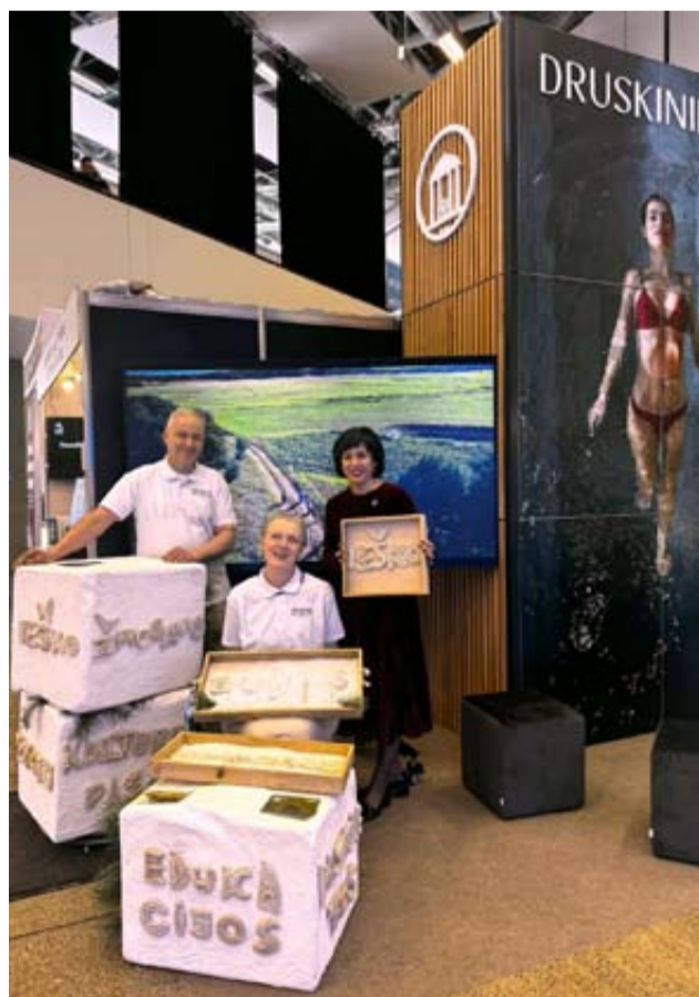
Kūrybos namų „Druskos studija“ edukacijoje mugės lankytojai išbandė kūrybines veiklas ir pažino Druskininkus per patirtį