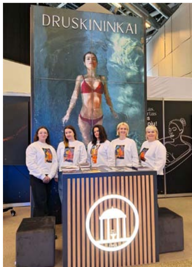
Druskininkų stendas Vilniaus knygų mugėje – „Kurortas, vertas knygų puslapių!“