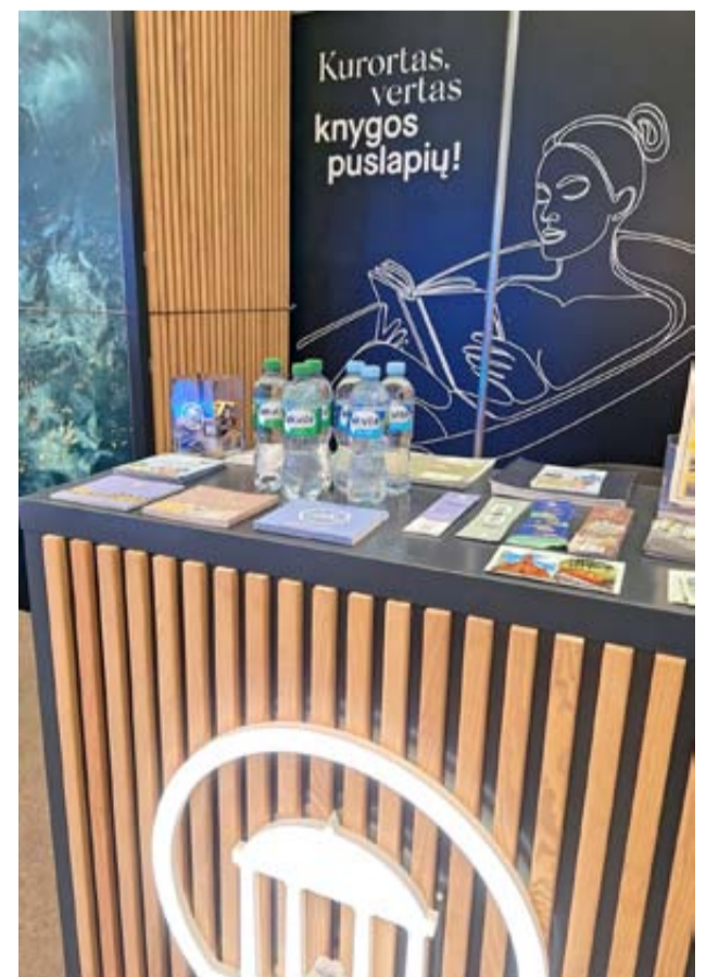
Druskininkų stende lankytojai galėjo atrasti kurorto naujienas ir atsigaivinti „Akvilė“ mineraliniu vandeniu