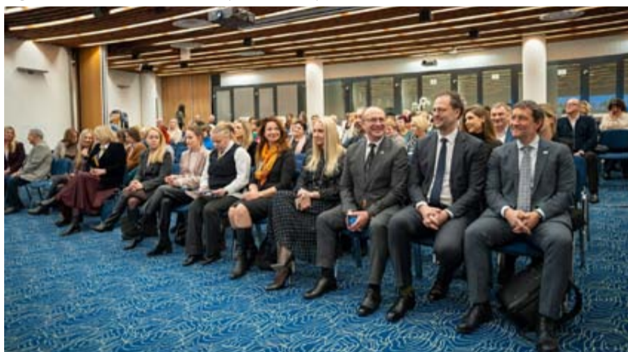
Renginyje akcentuota bendro komandinio NVC specialistų ir Druskininkų medikų darbo svarbą