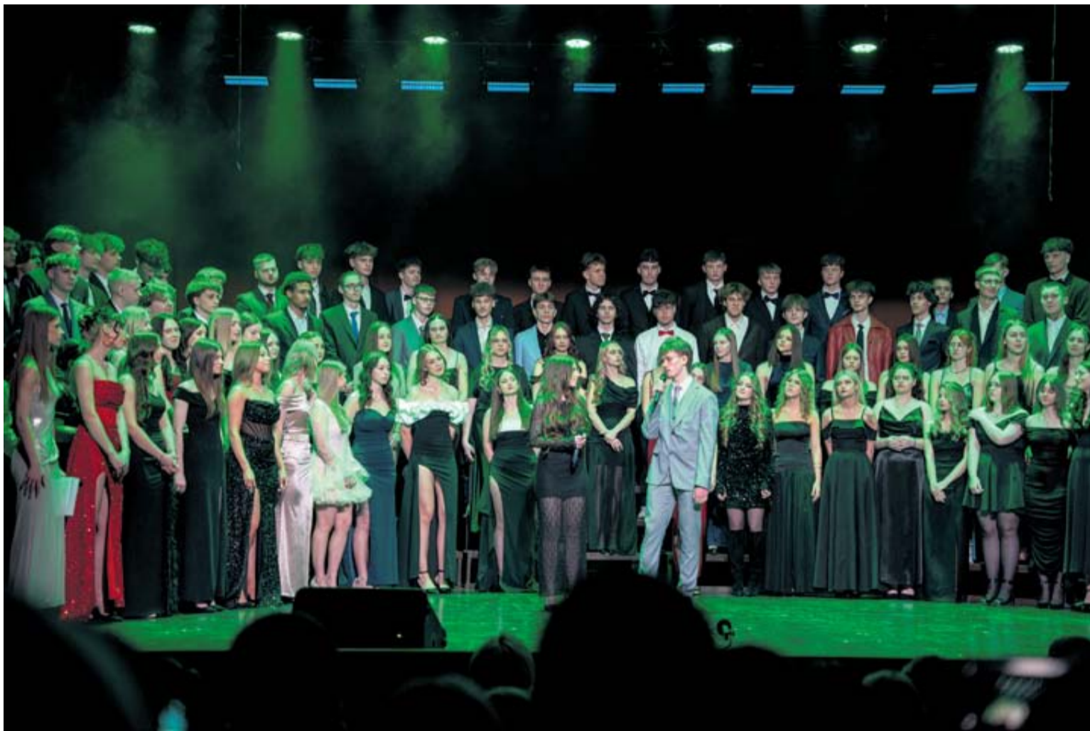
Penktadienį Druskininkų „Ryto“ gimnazijos abiturientai mokyklos bendruomenę pakvietė į ypatingą šventę – 51-osios laidos Šimtadienį