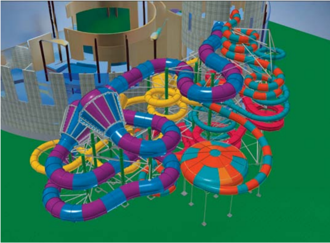
Naujų lauko nusileidimo kalnelių projektas

Vienas iš Druskininkų sveikatinimo ir poilsio centro „Aqua“ objektų – Vandens parkas – savo gyvavimo 20-ųjų metų pabaigoje pasitiks pastebimai atsinaujinęs. Šiuo metu pradėti didelio masto vandens pramogų erdvės atnaujinimo darbai, kuriems skiriamos milijoninės investicijos.