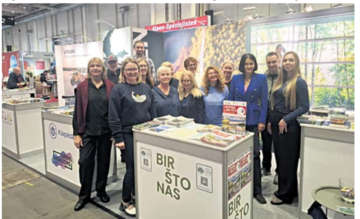
Druskininkai pristatyti Hamburge surengtoje didžiausioje laisvalaikio ir kelionių parodoje „EISEN & CARAVANING HAMBURG 2026“