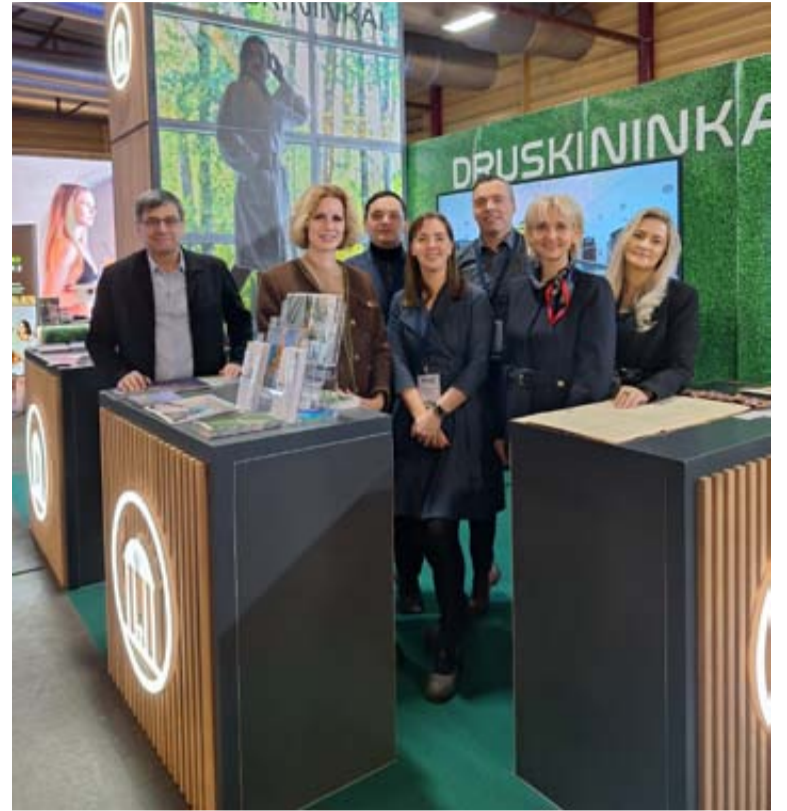
Druskininkų TVIC komanda kartu su kurorto verslo atstovais dalyvavo Latvijos sostinėje Rygoje organizuotoje turizmo parodoje „Balttour 2026“

Viena iš ryškiausių „Balttour“ kryptų – sveikatingumo ir SPA turizmas. Parodoje aktyviai prisitardė Baltijos šalių ir kitų Europos valstybių sanatorijos, SPA viešbučiai bei medicininio turizmo atstovai. Šis segmentas sulaukė didelio su-