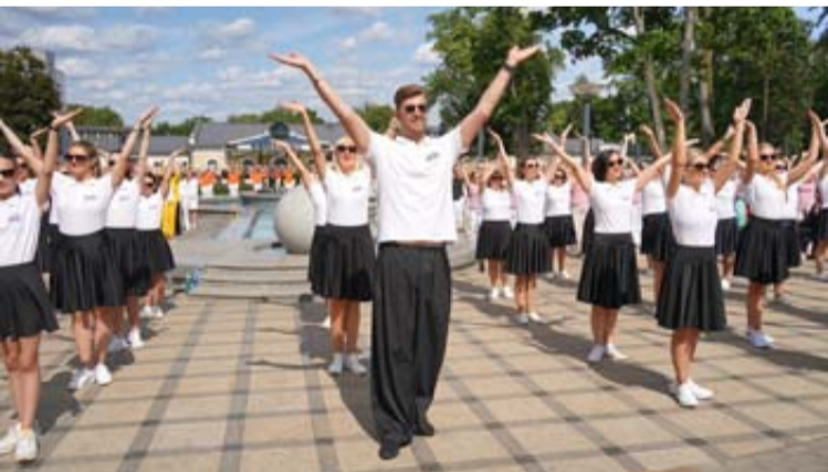
2026 metų kultūros projektų tema – „Ilgaamžiškumo kultūra ir sveikatingumo tradicijos Druskininkų kurorte“

Druskininkų savivaldybė kviečia kultūros organizacijas, įstaigas, bendruomenes bei kūrėjus teikti paraiškas 2026 metų kultūros projektų finansavimui.