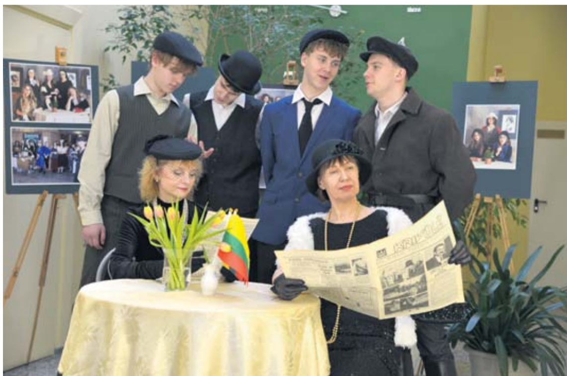
renginio „Ponas Tarpukaris“ fragmentai