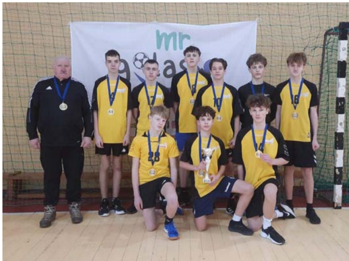
Jaunieji „Saulės“ pagrindinės mokyklos futbolininkai iškovoję pirmąją vietą ir teisę dalyvauti Lietuvos superfinale

Dauguose surengtose „MrGolas“ U-14 berniukų salės futbolo (FUTSAL) finalinėse varžybose, kuriose dalyvavo penkios komandos, puikiai pasirodė Druskininkams atstovavę „Saulės“ pagrindinės mokyklos futbolininkai.