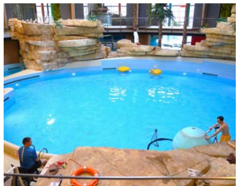
Vandens parke aktyviai vykdomi atnaujinimo darbai