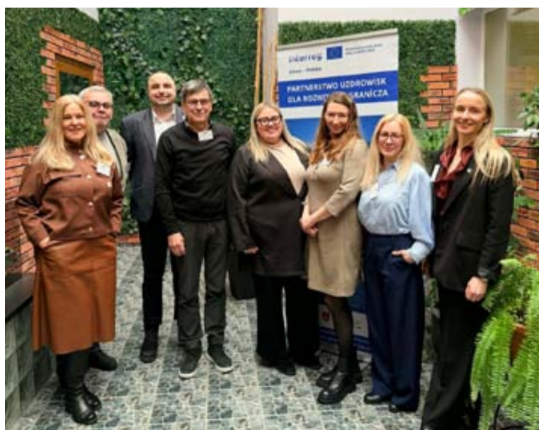
Druskininkų atstovai susitikime su projekto partneriais Augustave

Artimiausiu metu numatyti tolesni teminiai susitikimai ir konsultacijos su savivaldybių, turizmo, sveikatinimo, verslo bei bendruomenių atstovais. Parengta strategija bus pristatyta