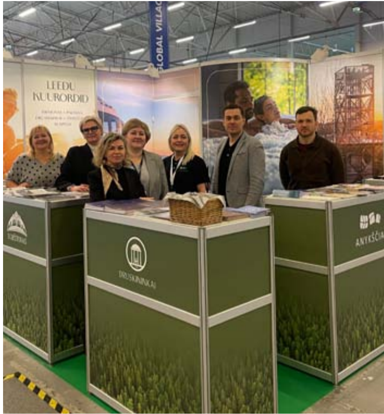
Taline surengtoje parodoje „Tourest 2026“ Druskininkai sulaukė didelio lankytojų susidomėjimo

Vokietijos keliautojai itin vertina poilsį gamtoje, kokybišką infrastruktūrą ir aukšto lygio paslaugas. Keliaujantiems nuosavu transportu Druskininkai tampa patogia pirmąja stotele Lietuvoje, atvykstant per pajūrį, arba jaukia poilsio oazę, kurioje galima atsipalaiduoti, mėgaujantis kurortiniais malonumais, erdviais pušynais ir tyru oru. Bendraujant su parodos lankytojais, paaiškėjo, kad dauguma iš jų jaučiasi saugiai, planuodami keliones į Lietuvą, ir yra