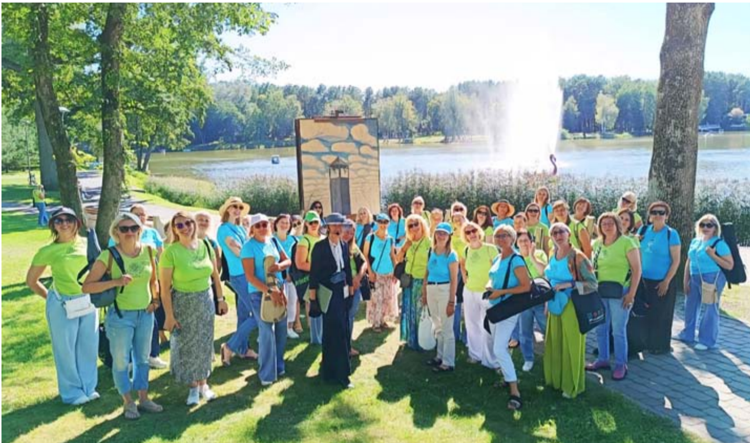
Druskininkų gidų siūlomos ekskursijos – tai daugiau nei faktai ar datos, tai gyvi pasakojimai, legendos, patirtys ir žmonės, padedantys kurortą pamatyti naujomis akimis