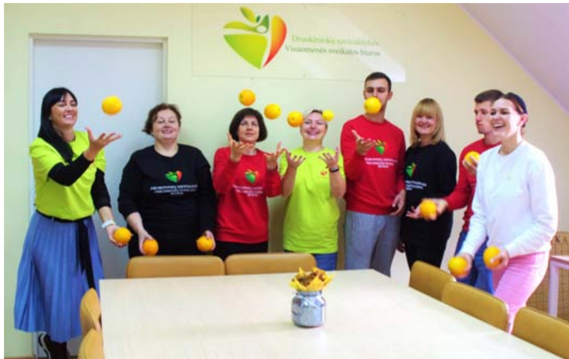
Stiprus tarpusavio ryšys yra viena iš didžiausių Druskininkų savivaldybės VSB sėkmės priežasčių