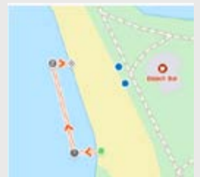
Vaikų triatlonas - 1 ratas