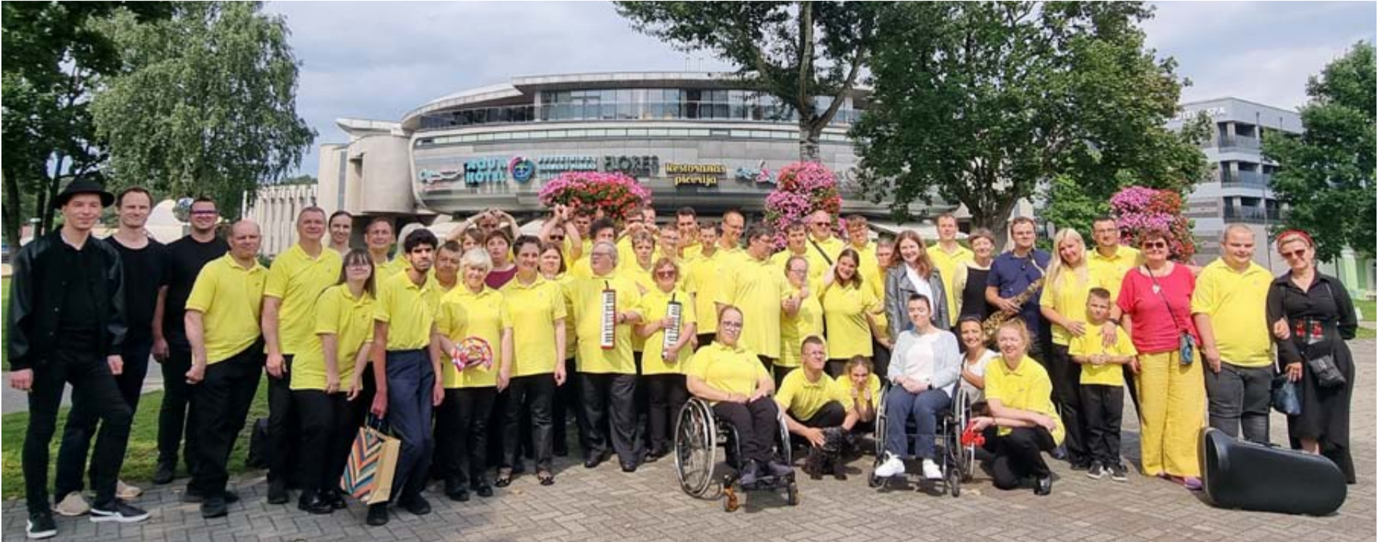
Šiais metais stovyklą vainikavo koncertas – akcija „Padėka Druskininkams“

Druskininkuose – 2025 metų Lietuvos kultūros sostinėje – jau dvidešimt penktą kartą šurmuliavo Lietuvos specialiosios kūrybos draugijos „Guboją“ muzikinė stovykla. Joje dalyvavo nacionalinio „Spalvų muzikos“ orkestro nariai bei Lietuvos vaikų ir jaunimo įtraukaus muzikavimo konkurso-festivalio „Perliukai“ laureatai iš visos šalies.