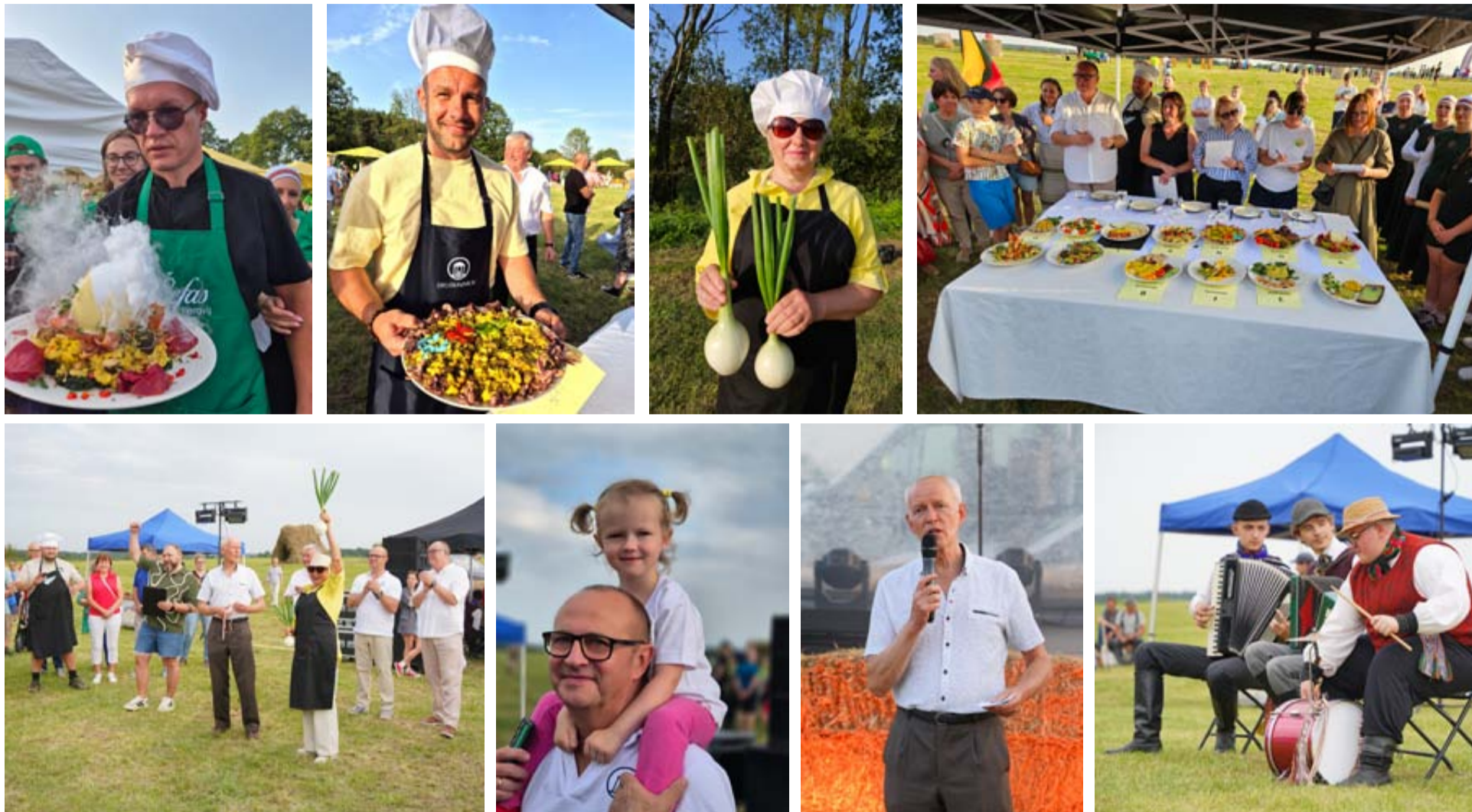
Sąskrydžio metu netrūko gerų emocijų, šilto bendravimo, o daugiausia smagių emocijų visiems padovanojo kiaušinienės iš stručių kiaušinių kepimo rungtis

Praėjusį penktadienį Švendubrėje Druskininkų vietos veiklos grupės organizuotas 15-asis kaimo bendruomenių sąskrydis buvo išskirtinis – tą dieną renginį atvykusios komandos nesivaržė tradicinėse rungtyse, o savo išmonę ir fantaziją pademonstravo, kepamos neįprastą patiekalą – kiaušinienę iš stručių kiaušinių.