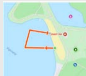
TRIFUN - 1 ratas