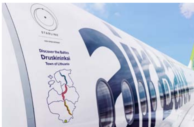
Druskininkų kurorto vardu pavadintas bendrovės „airBaltic“ orlaivis jau vykdo reguliarius skrydžius

Baltijos šalių oro linijų bendrovė „airBaltic“ praėjusių metų vasarą surengė orlaivių pavadinimų konkursą, skirtą 35-osioms Baltijos kelio metinėms paminėti ir pakvietė visuomenę balsuoti už mylimiausius Latvijos, Estijos ir Lietuvos miestus. Iš viso balsavimo laikotarpiu – nuo rugpjūčio 5 d. iki rugpjūčio 22 d. – buvo atiduota daugiau nei milijonas balsų. Galutiniame sąrašė atsidadė 48 miestai – po 16 iš kiekvienos Baltijos šalies.