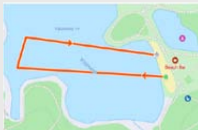
OD - 2 ratai; SD - 1 ratas