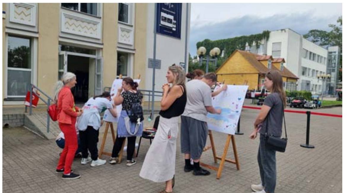
Druskininkai tapo orkestrantų vasaros rezidencija, į kurią visada norisi sugrįžti

nys vyko Druskininkų Pramogų aikštėje ir buvo dedikuotas 2025 metų Lietuvos kultūros sostinei – Druskininkams.