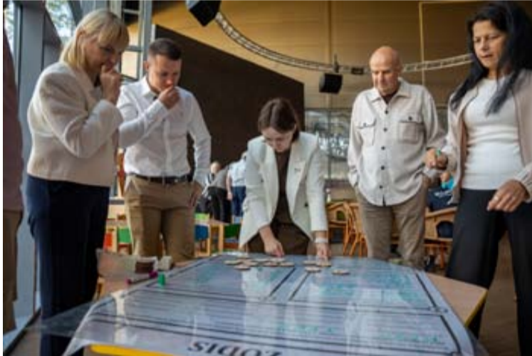
Konferencijos dalyviai išbandė užduotis, skatinančias komandinį darbą, kūrybiškumą