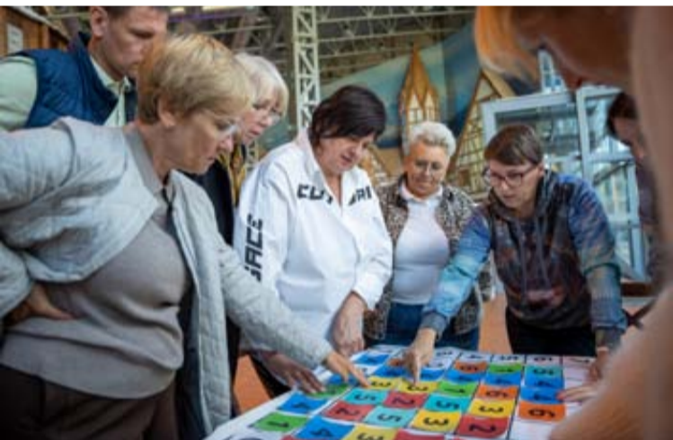
Neformalus susitikimai padeda kurti stipresnę, draugiškesnę ir efektyviau veikiančią ugdymo bendruomenę

Rugpjūčio 28-ąją į „Snow Arena“ erdves susirinko beveik penkiasdešimt švietimo bendruomenės atstovų: mokyklų vadovai, jų pavaduotojai ugdymui ir ūkiui, Švietimo centro komanda, partneriai ir savivaldos atstovai. Kasmetė švietimo vadovų konferencija šiemet surengta kiek kitu formatu – daugiau dėmesio skirta ne tik profesinėms diskusijoms, bet ir bendrystės bei komandinio darbo stiprinimui.