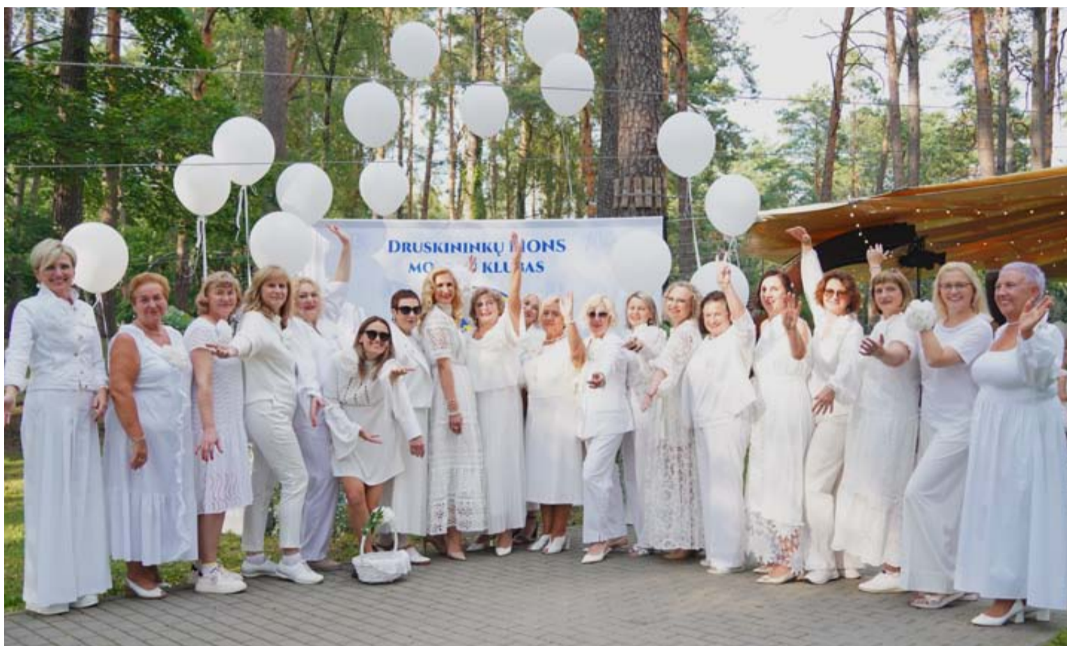
Druskininkų LIONS moterų klubo narės dėkoja kiekvienam, pirkusiam bilietus ir taip parėmusiam gražų bei prasmingą renginį, jos dėkingos visiems, kurie dalijosi vakaro šviesa, šypsenomis ir gerumu

Praėjusį ketvirtadienį Druskininkuose surengtas pirmasis „Baltas vakaras“. Net dangus tądien sugrąžino vasarą – buvo neįprastai šiai vasarai šilta ir saulėta. K. Dineikos parke, nuo seno nepaprastai tinkančiame skatinti bendrystę ir kasdienybės džiaugsmą, susirinko daugiau kaip keli šimtai baltai pasipuošusių žmonių, tą vakarą paskyrusių prasmingai veiklai – labdarai. Vakarą misija buvo surinkti paramą sunkiai sergantiems Druskininkų savivaldybės vaikams.