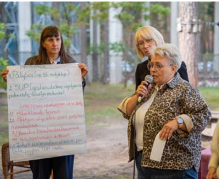
Pateiktos užduotys reikalauja greito reagavimo ir efektyvios komunikacijos