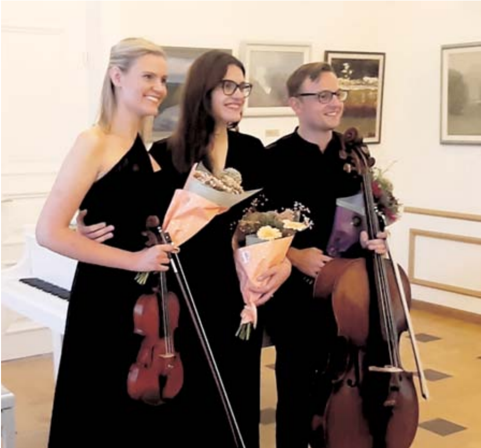
Miesto muziejuje koncertą surengė talentingų jaunuolių grupė „META“