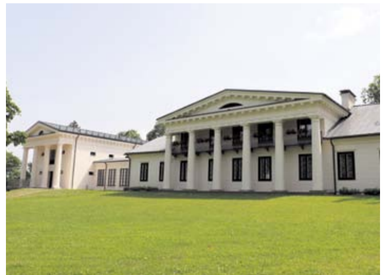
Leipalingio bendruomenė sukurs edukacinę programą, kuri atspindės miestelio istoriją ir turės išliekamąją vertę