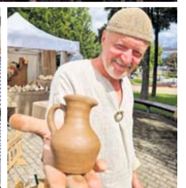
Tris dienas ir tris naktis Druskininkuose aidėjo lamzdžiai, dundėjo būgnai, griežė kapelijos, skambėjo dainos ir trinkėjo šokiai, dirbo amatininkai, šventės lankytojų dėmesio sulaukė amatų edukacijos