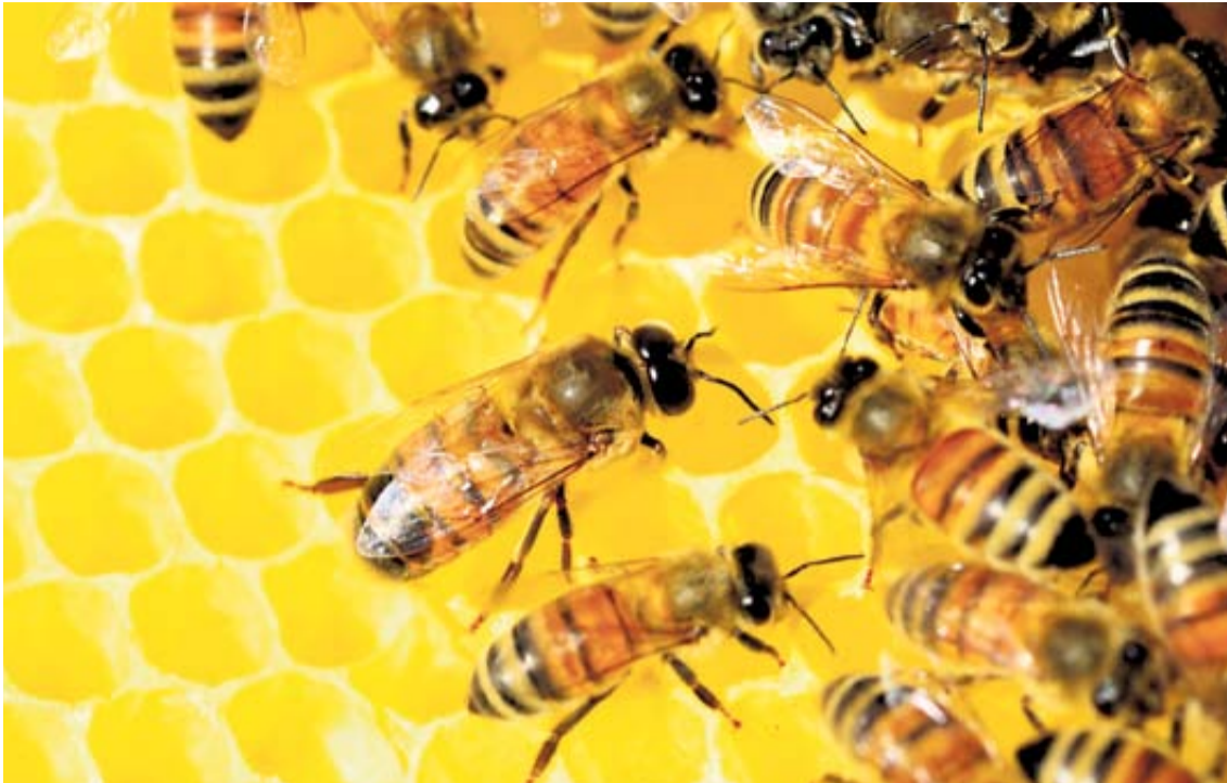
Bičių laikytojai kviečiami teikti paraiškas paramai už papildomą bičių maitinimą gauti / Asociatyvi nuotrauka

Vadovaujantis Paramos teikimo bičių laikytojams už papildomą bičių maitinimą taisyklėmis, patvirtintomis Lietuvos Respublikos žemės ūkio ministro 2008 m. birželio 26 d. įsakymu Nr. 3D-357 „Dėl Paramos teikimo bičių laikytojams už papildomą bičių maitinimą taisyklių patvirtinimo“, bičių laikytojai kviečiami iki 2022 m. rugsėjo 15 d. (įskaitytinai) teikti paraiškas paramai už papildomą bičių maitinimą gauti.