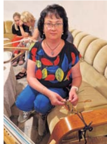
Viečiūnų bendruomenės centre organizuotos audimo savaitės „Dzūkijos dzyvai“ metu buvo galima susipažinti su audimo amato subtilybėmis

Liepos 25-29 dienomis Viečiūnų bendruomenės centre organizuotos audimo savaitės „Dzūkijos dzyvai“ metu buvo galima susipažinti su audimo amato subtilybėmis. Antrąkart surengtos audimo savaitės pagrindinė tema – dzūkiškos prijuostės audimas. Audimo savaitės metu buvo galima mokyti pas 5 audimo meistrus, pagilinti savo žinias arba įgyti audimo pradžmę. Audimo savaitę organizavo Lietuvos tautodailininkų sąjungos Dzūkijos skyrius. Patalpas suteikė Viečiūnų seniūnija, parėmė Kultūros taryba ir Druskininkų savi-valdybė.