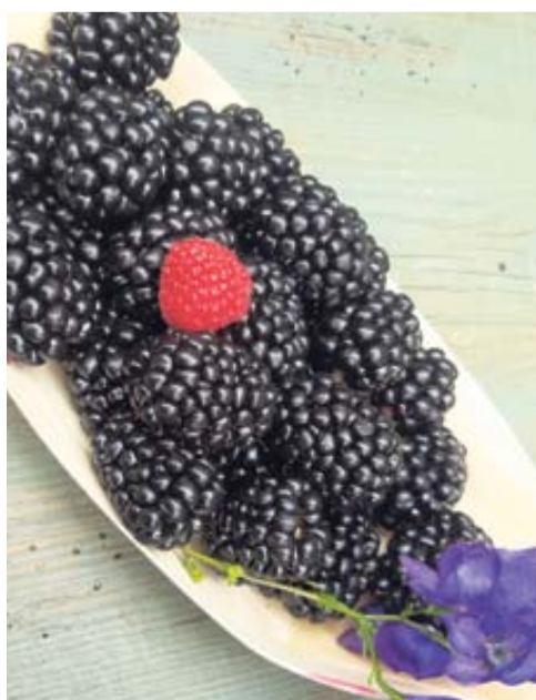
„Geniorojaus“ ūkyje auginami produktai – smidrai ir gervuogės – atitinka sveikatai palankaus maisto, ženklinamo tarptautiniu „Rakto skylutės“ simboliu