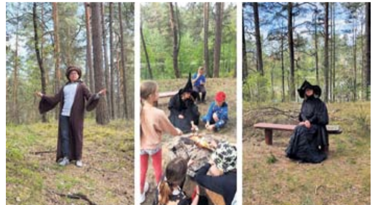
Neraviškiai stengėsi sukurti tokį regioninį produktą, kuris atskleistų Neravų kaimo bendruomenės krašto unikalumą