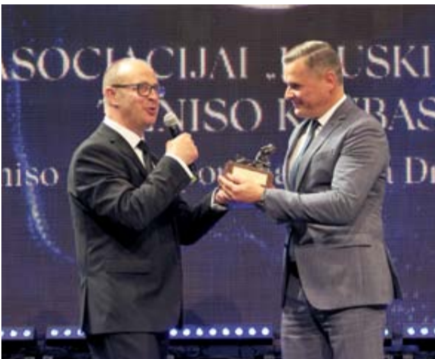
Druskininkų teniso klubas Už indėlį plėtojant teniso sportą