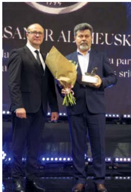
„Yukon Advanced Optics Worldwide“ Už bendradarbiavimą ir reikšmingą paramą sveikatos ir kultūros srityse