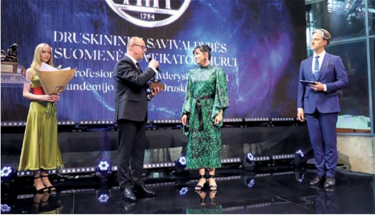
Druskininkų savivaldybės visuomenės sveikatos biuras Už druskininkiečių sveikatos stiprinimą ir sveiko gyvenimo būdo vertybių puoselėjimą