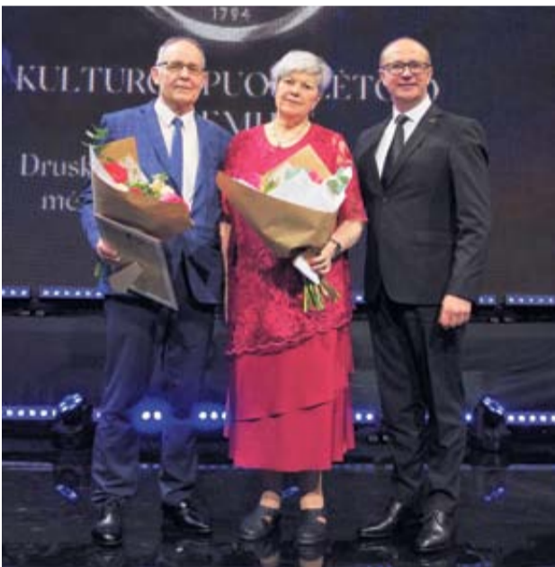
Kultūros puoselėtojo premija Druskininkų poezijos ir kitų menų mėgėjų asociacija „Branduma“