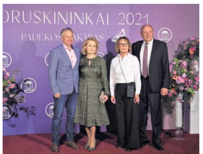
Padėkos vakaro fragmentai