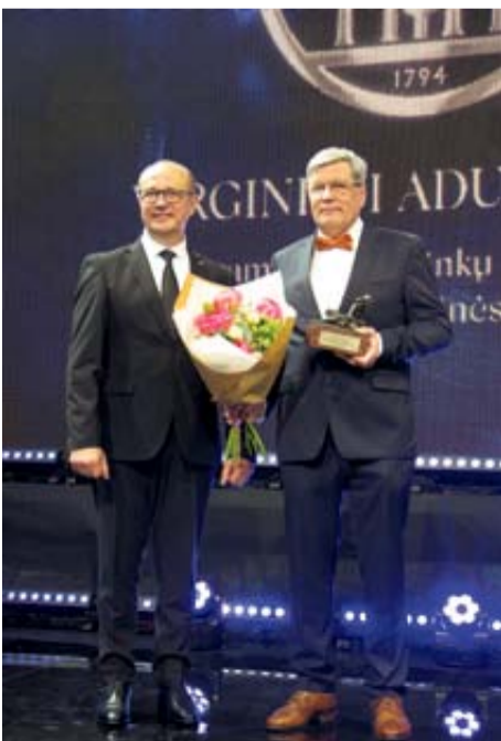
UAB „Veritas Ana“ Už socialiai atsakingą požiūrį ir paramą Druskininkų Švč. Mergelės Marijos Škaplierinės bažnyčiai