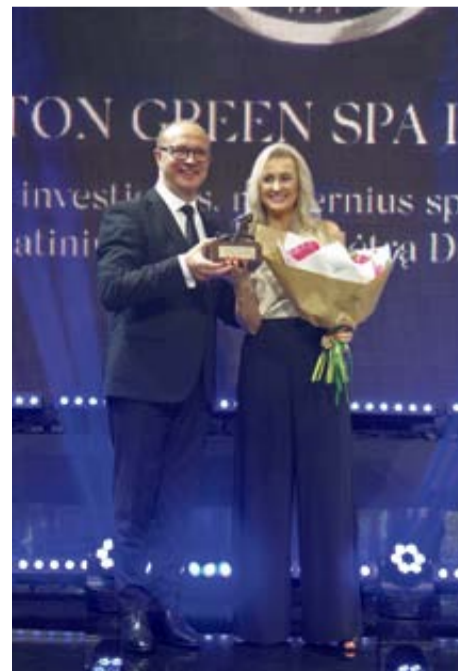
„Amberton Green SPA Druskininkai“ Už investicijas, modernius sprendimus ir sveikatinimo paslaugų plėtrą Druskininkuose