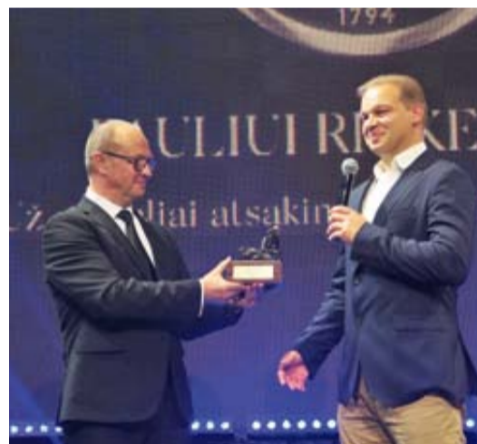
UAB „Galia“ Už socialiai atsakingą verslą ir pilietiškumą