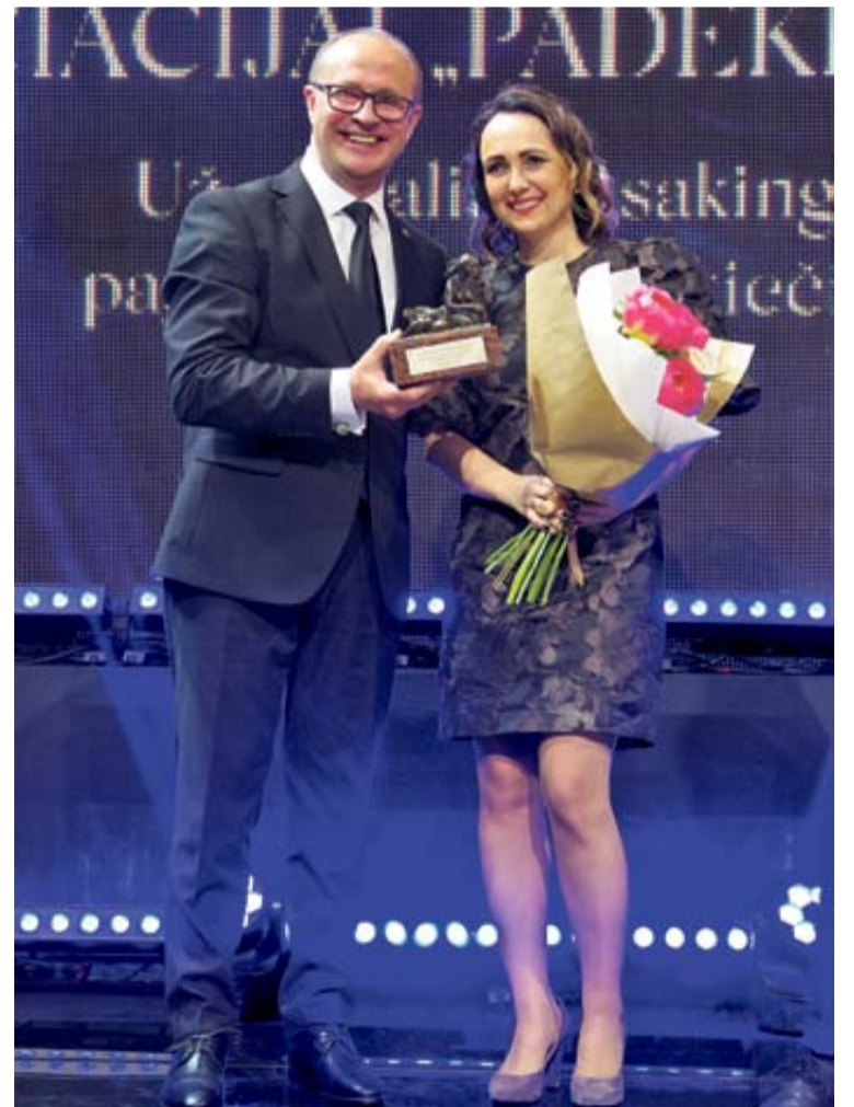
Asociacija „Padėkime vaikams“ Už reikšmingą socialinę veiklą ir savanorystės skatinimą