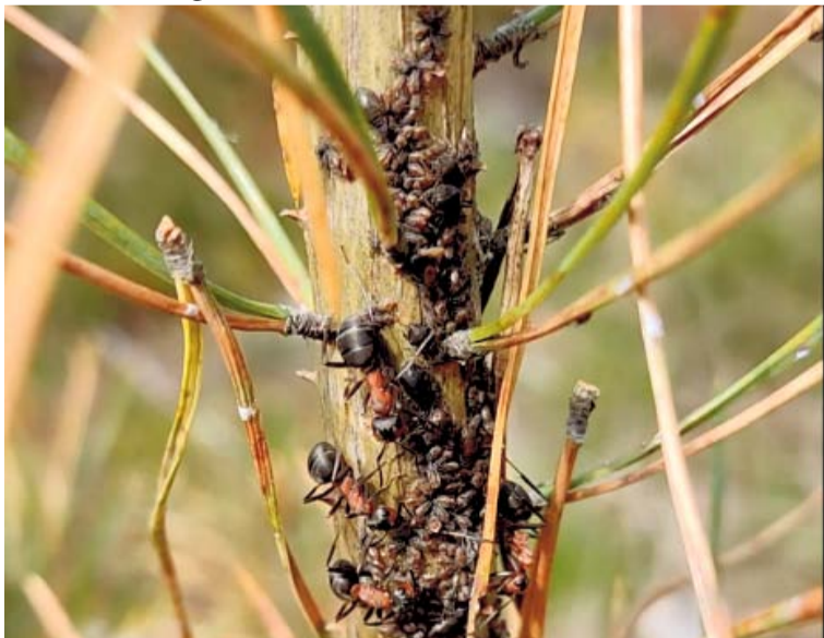
Amarų ir skruzdžių kolonija / Asociatyvi nuotrauka

Šakių rajono šiluose augančiuose želdiniuose ir žėlinuose 2022-05-19 VMT Miško sanitarinės apsaugos skyriaus specialistas pastebėjo gelsnčiais, ruduojančiais ir džiūstančiais spygliais pušes. Jaunų pušaičių spyglius pažeidė infekcinė liga – pušų