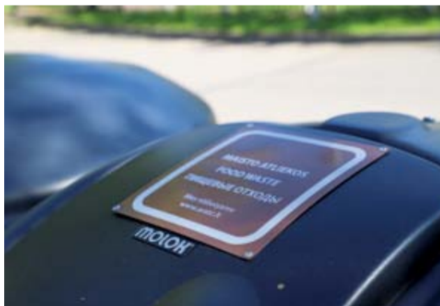
2021 metų pradžioje prie įprastų atliekų konteinerių iškilo dar vienas – skirtas maisto atliekoms