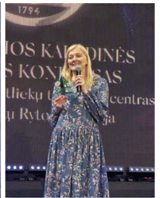
Gražiausios kalėdinės eglutės konkurse, komisijos sprendimu, nugalėjo Druskininkų „Ryto“ gimnazija