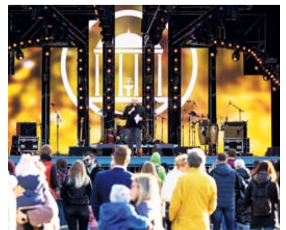
Druskininkiečiams ir miesto svečiams buvo parengta turininga, vaizdinga, labai muzikali ir įspūdinga šventė