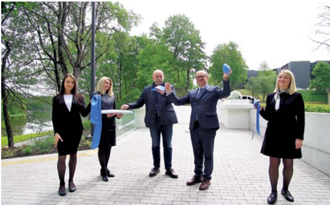
Praėjusį penktadienį perkirpta simbolinė rekonstruoto Druskininkų centre, vaizdingoje Nemuno ir Ratnyčios upių santakoje esančio lenkto tiltelio atidarymo juostelė

Šis tiltas kurorte pastatytas apie 1953 m. 1962 metais šalia jo pastatyta skulptoriaus B. Vyšniausko skulptūra „Ratnyčėlė“, tapusi Druskininkų simboliu.