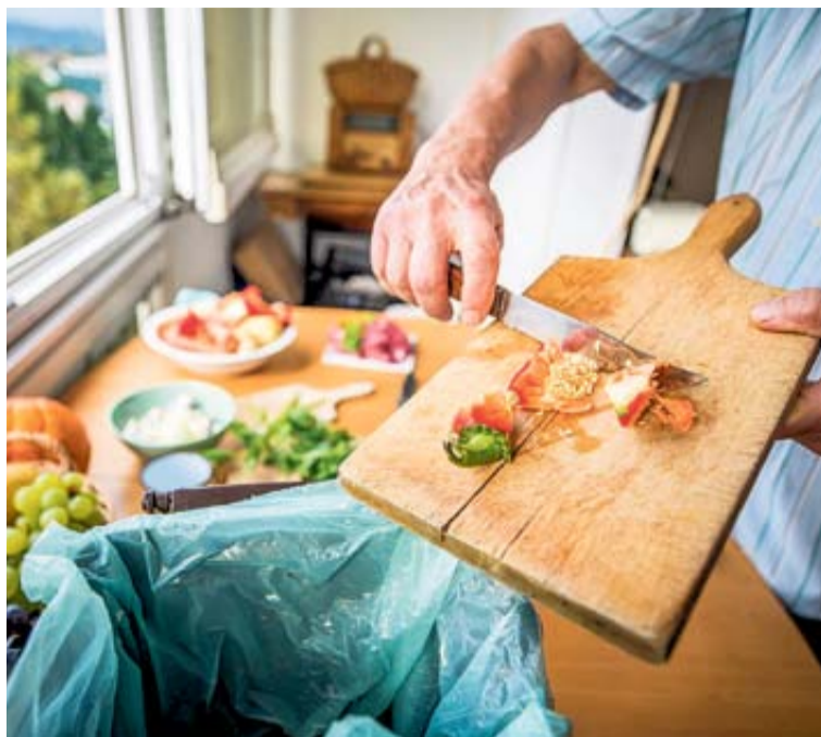
Maisto atliekų rūšiojimas turi ir didelę ekonominę naudą – tinkamai jas rūšiuojant, galima sutaupyti dideles pinigų sumas / Asociatyvi nuotrauka

Liko mažiau nei dveji metai iki 2024-ųjų, kai įsigalios Europos Sąjungos direktyva, nurodanti, kad maisto atliekas rūšiuoti privaloma visiems. Kol kitos savivaldybės dar tik pradeda apie šią prievolę kalbėti ir galvoti, kaip sukurti maisto atliekų rūšiojimo sistemą, druskininkiečiai, pirmieji Lietuvoje pradėję rūšiuoti maisto atliekas, tai daro labai sėkmingai.