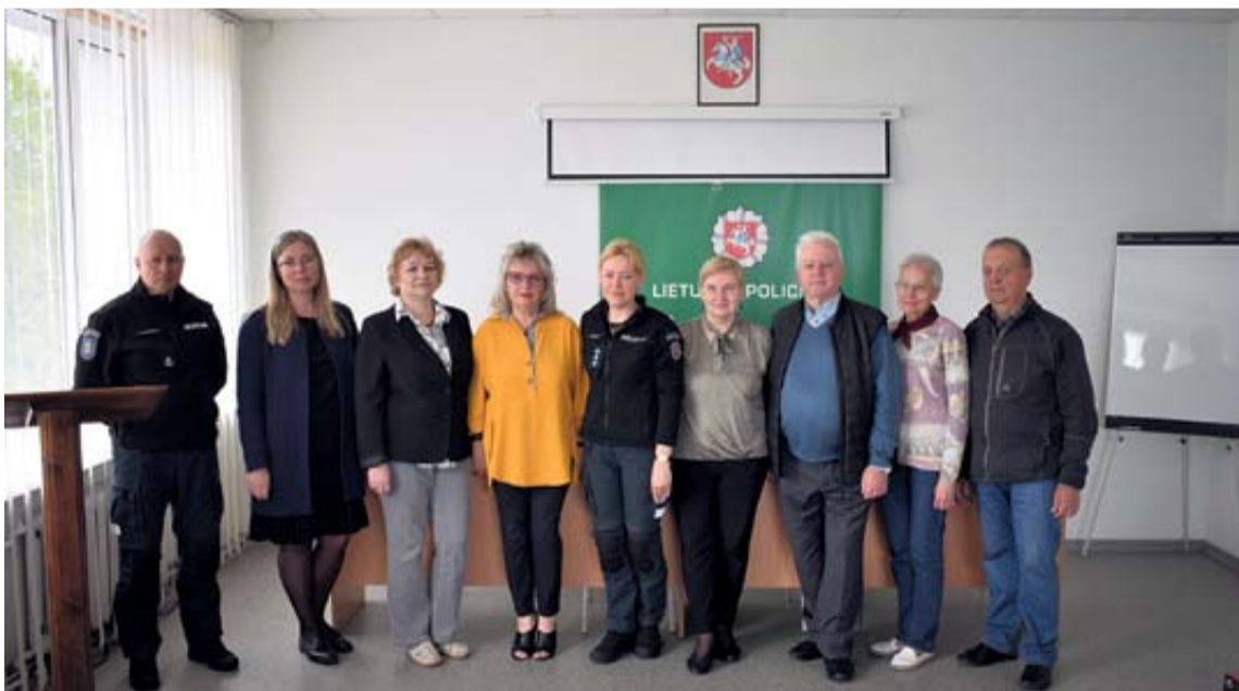
Druskininkų policijos komisariatare buvo pasveikinti konkurso „Kaimynų kaimynas“ dalyviai

Jau tampa tradicija kiekvienais metais, paskutinį gegužės penktadienį, minint Europos kaimynų dieną, pagerbti geriausius kaimynus. Tą dieną Druskininkų policijos komisariatare buvo pasveikinti konkurso „Kaimynų kaimynas“ dalyviai.