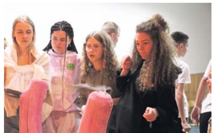
Leipalingio miestelio bendruomenė šventė Šeimos dieną