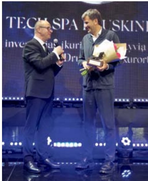
„Tech SPA Druskininkai“ Už investicijas įkuriant inovatyvią darbstogų erdvę Druskininkų kurorte