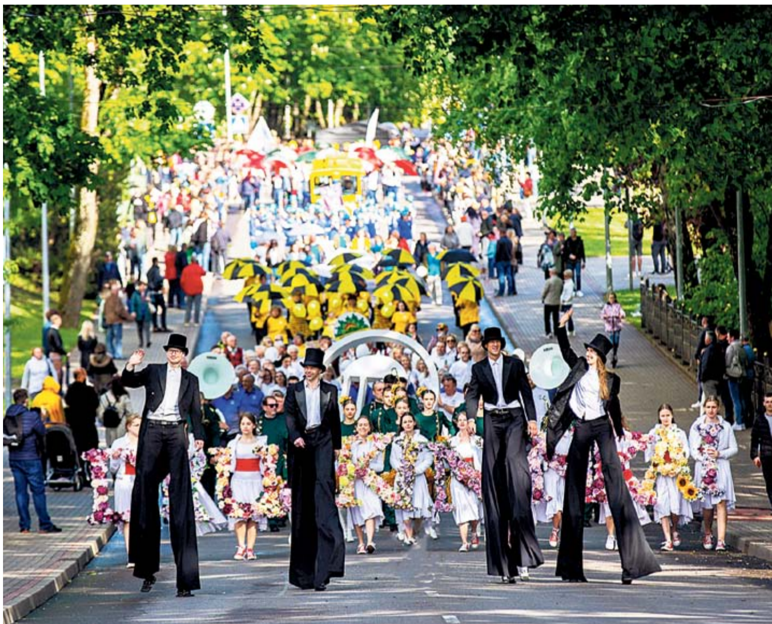
Šventės pradžią paskelbė išradinga ir pašėlusiai linksma teatralizuota Druskininkų bendruomenės eiseną, po dvejų metų pertraukos pagaliau sugrįžusi į kurortą

Praejęs savaitgalis parodė, kad daugelio mūsų tautiečių, ištroškusių poilsio ir pramogų, keliai vedė į Lietuvos pietus – Druskininkų kurortą. Po pandeminių stabdžių ir dvejų metų pertraukos mieste vėl galingai suskambėjo tradicinė Druskininkų kurorto šventė, pakvietusi visą Lietuvą kartu pasitikti vasaros pradžią.