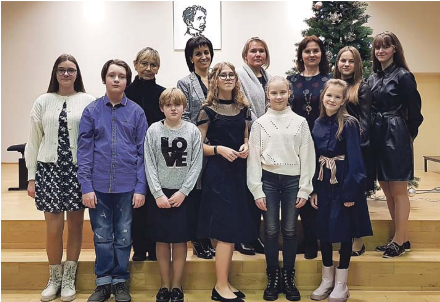
Festivalio-maratono dalyviai su mokytojomis

Druskininkų M. K. Čiurlionio meno mokykla, pasibaigus pirmajam mokslo metų pusmečiui, tikrai turi kuo pasidžiaugti – konkursuose iškovoti ir laureatų, ir Grand Prix diplomai.