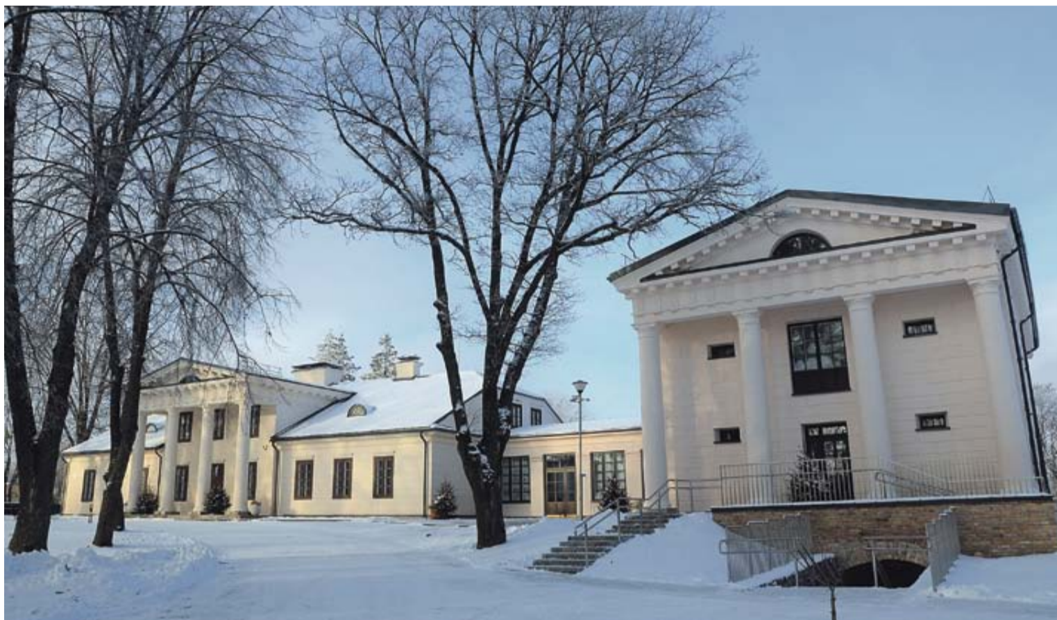
Leipalingio miestelio istorinė širdis ima plakti nauju ritmu ir spindi visu gražumu. Prasideda naujasis dvaro gyvavimo etapas

Gruodžio 28-ąją iškilmingai atidaryta Leipalingio dvaro, skaičiuojančio kelis šimtmečius, antroji dalis. Visiškai atgimęs dvaras po kapitalinės rekonstrukcijos sugražintas į bendruomenės gyvenimą. Leipalingio miestelio istorinė širdis ima plakti nauju ritmu ir spindi visu gražumu. Prasideda naujasis dvaro gyvavimo etapas.