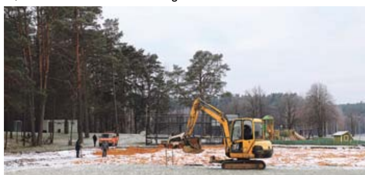
Prie Vijūnėlės tvenkinio, vietoj senosios tinklinio aikštelės, įrengiama universali paplūdimio tinklinio, futbolo ir rankinio varžybos pritaikyta smėlio aikštelė su tribūnomis

Po susitikimo savivaldybėje svečiai išvyko į „Snow Areną“, apžiūrėjo jos erdves ir aptarė galimybes organizuoti jose tinklininkų treniruotes bei varžybas.