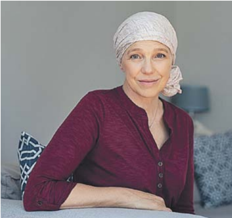
Vėžys – nėra mirties nuosprendis, tačiau labai svarbu jį diagnozuoti laiku/Asociatyvi nuotrauka

Krūties vėžys – dažniausia moterų onkologinė liga Lietuvoje. Bet kuri moteris per gyvenimą turi apie 10 proc. riziką susirgti krūties vėžiu. Dauguma vėžio atvejų yra atsitiktiniai, jiems įtaką padaro susirgimų riziką didinantys veiksniai (alkoholio vartojimas, moters amžius, praeityje buvę krūties vėžio susirgimai, antsvoris ir kiti), 5-10 proc. atvejų lemia genetiniai, paveldimi veiksniai, jei šeimoje yra sergančių šia liga.