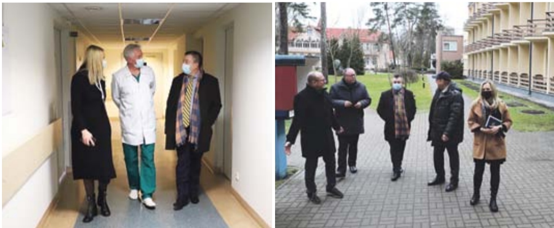
LR Seimo Sveikatos reikalų komiteto pirmininko A. Matulo aplankymo metu diskutuota apie šiuo metu Lietuvoje planuojamą įgyvendinti sveikatos priežiūros įstaigų reformą, išsamiai pristatyta, ko iš jos tikisi Druskininkai