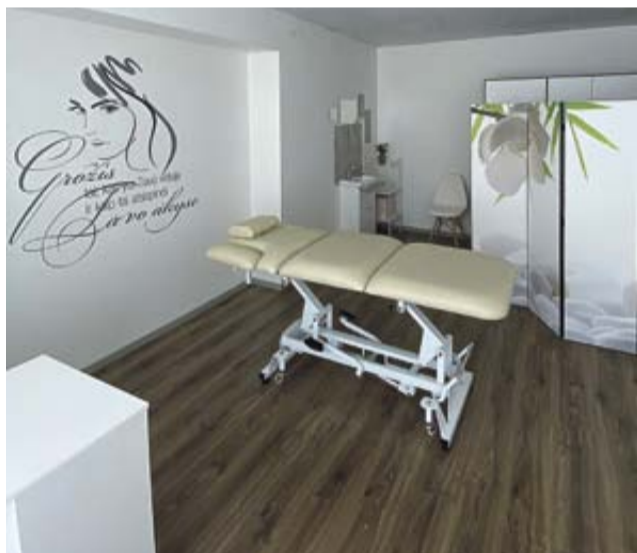
Patalpos būsimam masažo salonui Eišiškėse