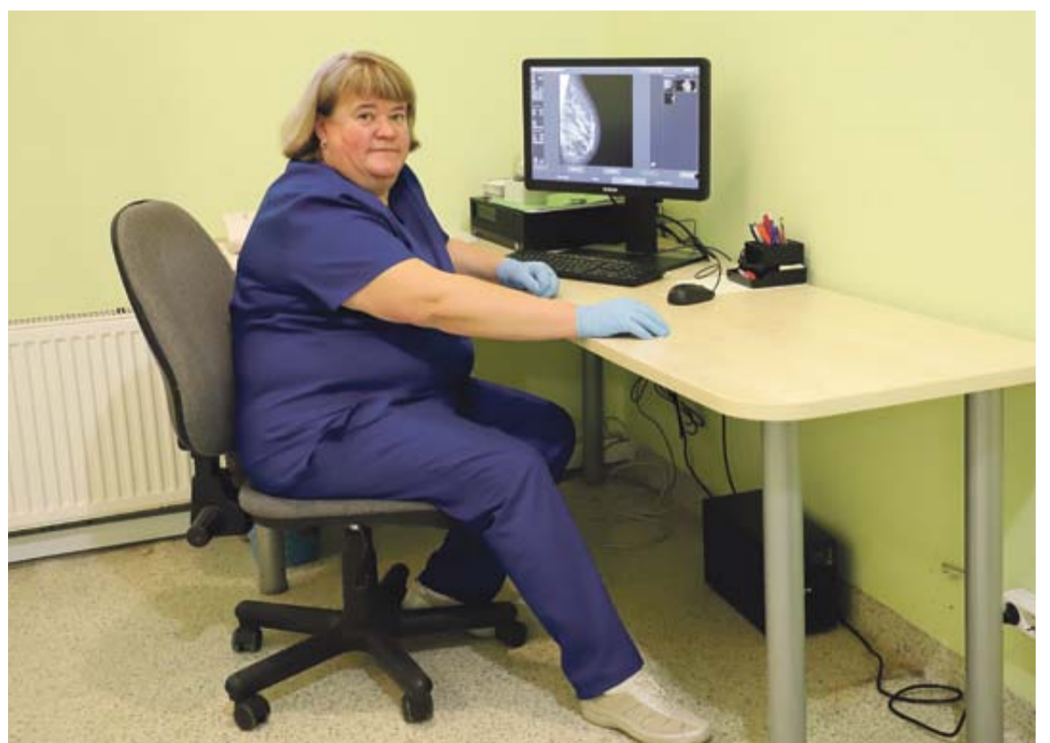
Druskininkų ligoninėje praėjusiais metais įdiegtas naujasis skaitmenizuotas mamografas – moterų patikra ir konsultacijos tapo žymiai greitesnės ir išsamesnės

REGISTRACIJA TELEFONU (8 313) 52 382 arba (8 313) 52 289