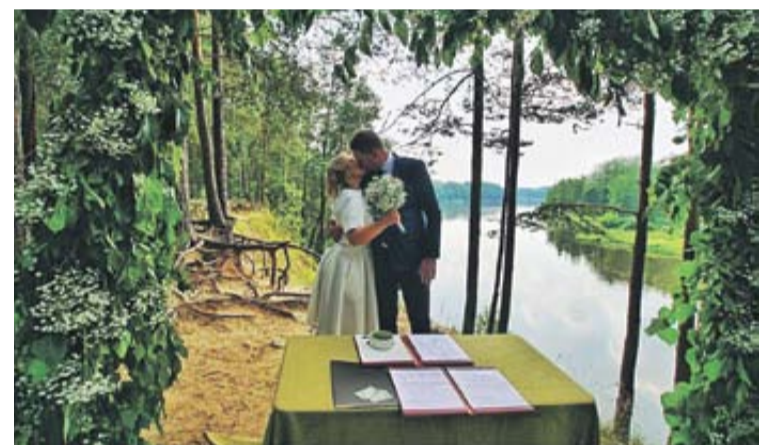
Druskininkų Teisės ir civilinės metrikacijos skyriaus pateikta praėjusių metų statistika rodo, kad 2021-aisiais kurorte daugėjo santuokų

Druskininkų Teisės ir civilinės metrikacijos skyriaus pateikta praėjusių metų statistika rodo, kad 2021-aisiais kurorte daugėjo santuokų – jaunavedžiai iš visos Lietuvos ir toliau rinkosi savo santykius įteisinti Druskininkuose.