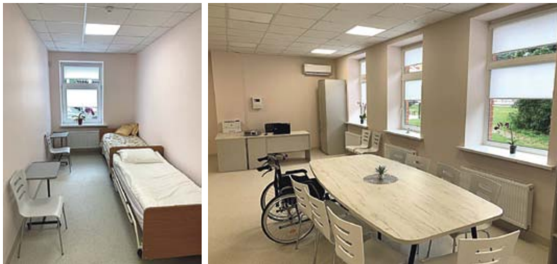
Centre sudaryta galimybė gauti maitinimą, fizioterapijos, kineziterapijos ar ergoterapijos procedūras

Sveikatos g. 30 patalpose įrengtas Druskininkų savivaldybės socialinių paslaugų centro neįgaliųjų dienos centras, skirtas asmenims su negalia ir senyvo amžiaus asmenims.