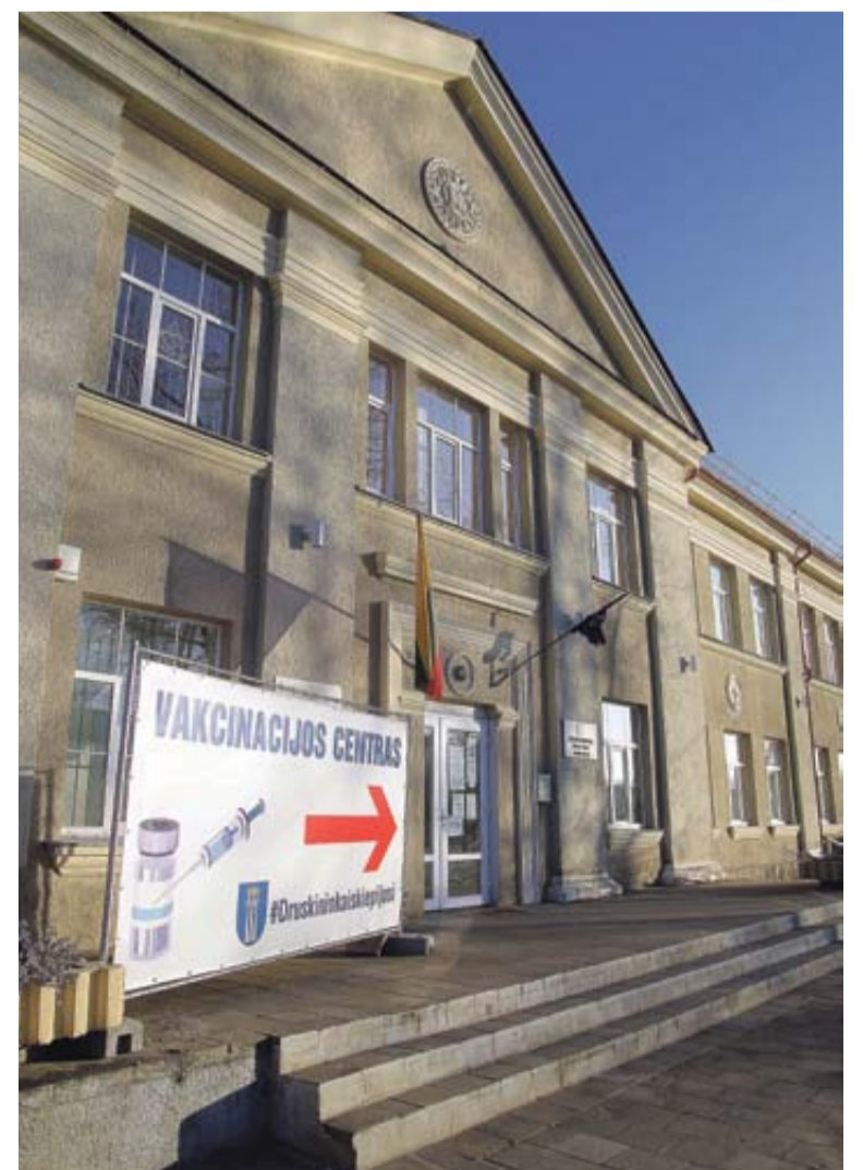
Pasiskiepyti sustiprinančiąja skiepų doze galima vakcinacijos centre (Druskininkų švietimo centro patalpose, M. K. Čiurlionio g. 80) kiekvieną darbo dieną nuo 8 iki 14 val.