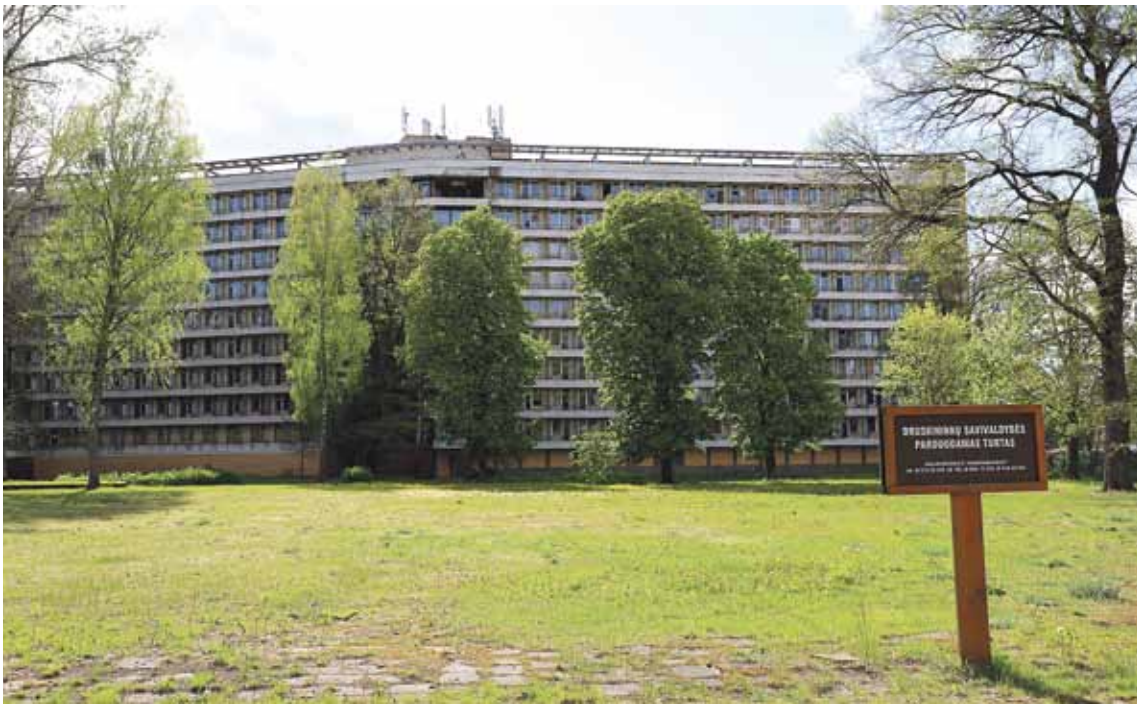
Druskininkų savivaldybės administracija paskelbė buvusios sanatorijos „Nemunas“ pastatų ir jiems priskirto žemės sklypo Liepų g. 1 viešą elektroninį pardavimo aukcioną

Druskininkų savivaldybės administracija paskelbė buvusios sanatorijos „Nemunas“ pastatų (1328,45 kv. m., 1 520,44 kv. m. ir 16 558,23 kv. m.) ir jiems priskirto 2,1513 ha žemės sklypo Liepų g. 1 viešą elektroninį pardavimo aukcioną.