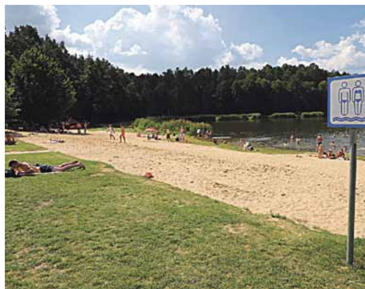
Atlikti vandens kokybės tyrimai parodė, kad Druskininkų vandens telkiniuose vanduo atitinka higienos normos reikalavimus

Vasaros sezono metu druskininkiečiai ir kurorto svečiai renkas poilsį gamtoje bei pramogauja, maudydamiesi ežeruose ir tvenkiniuose. Druskininkų savivaldybėje maudymosi sezonas trunka nuo gegužės 15 d. iki rugsėjo 15 d.