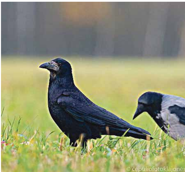
Varnos laikomos vienais iš protingiausių paukščių/Laimučio Genio nuotrauka