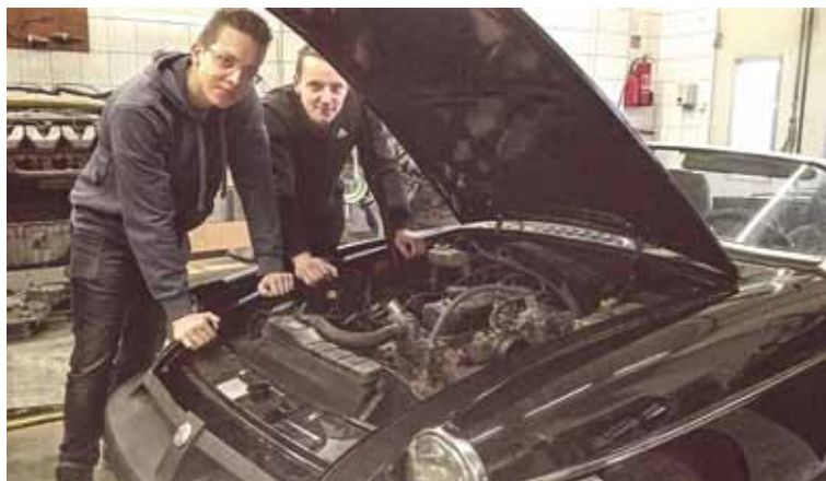
Automobilių elektros įrengimų remontininkas – nauja perspektyvi profesija

Nauja profesija – automobilių elektros įrengimų remontininkas. Automobilių elektros įrengimų remontininkas turi išmanyti automobilio agregatų, mechanizmų ir sistemų paskirtį, sandarą, veikimą, diagnozuoti automobilio elektros įrenginių techninę būklę, nustatyti gedimus ir jų priežastis, atlikti techninės priežiūros ir remonto darbus, žinoti automobilių elektroninių valdymo sistemų sandarą, veikimą, atlikti jų diagnostikos ir techninės priežiūros darbus. Jis taip pat turi gebėti naudotis technine literatūra, informacinėmis technologijomis, skaityti automobilių detalių, mazgų darbo ir surinkimo brėžinius, principines ir montazines automobilių elektros įrenginių schemas.