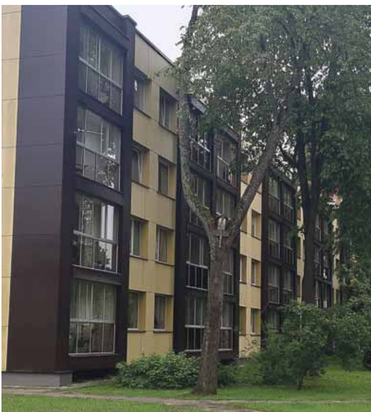
Šio Vytauto gatvės namo gyventojai praėjusią savaitę tapo žiauraus elgesio su gyvūnais liudininkais