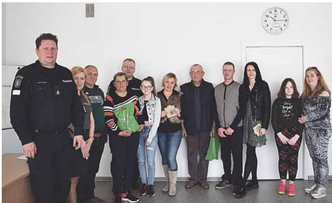
Druskininkų policijos komisariatare pasveikinti konkurso „Kaimynų kaimynas“ dalyviai

Birželio 5 dieną Druskininkų policijos komisariatare pasveikinti konkurso „Kaimynų kaimynas“ dalyviai. Konkurso tikslas buvo pastebėti šalia savęs kuo nors ypatingą žmogų – kaimyną, vertą, kad apie jį sužinotų ir kiti. Juk šalia mūsų gyvena daug įdomių žmonių. Vienas leidžia laiką, skirdamas jį įdomiam hobiui, kitas daug domisi šalies ar savo krašto istorija, taigi tokio žmogaus tiesiog įdomu pasiklausti. Yra žmonių, kurie visa širdimi atsidavę savo profesijai ir savo ryžtu užkrečia kitus, o yra tokių, kurie tiesiog spin-