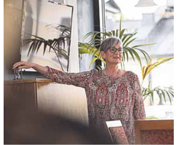
Kūrybinio įkvėpimo, idėjų moterys sėmėsi viena iš kitos, dalijosi savo pomėgiais ir veiklomis, šypsojosi, muzikavo, piešė, šoko, dainavo, diskutavo, skraidino svajones ir norus

bendradarbės, bendramintės susitikimo pačioje Druskininkų kurorto širdyje, fotografavosi įvairiose gražiausio Lietuvos kurorto erdvėse ir lankėsi „Sijonuotos vasaros'20 sutiktuvės Druskininkuose“ renginiuose.