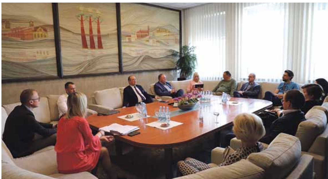
Savivaldybės vadovai susitikime su didžiųjų sveikatinimo, poilsio ir pramogų paslaugas teikiančių įstaigų atstovais aptarė turizmo aktualijas

Praėjusią savaitę Savivaldybės vadovai susitiko su didžiųjų sveikatinimo, poilsio ir pramogų paslaugas teikiančių įstaigų atstovais kalbėjosi, kaip jiems sekasi atverti duris turistams, kokia šiuo metu yra užimtumo situacija, aptarė kitas turizmo aktualijas.