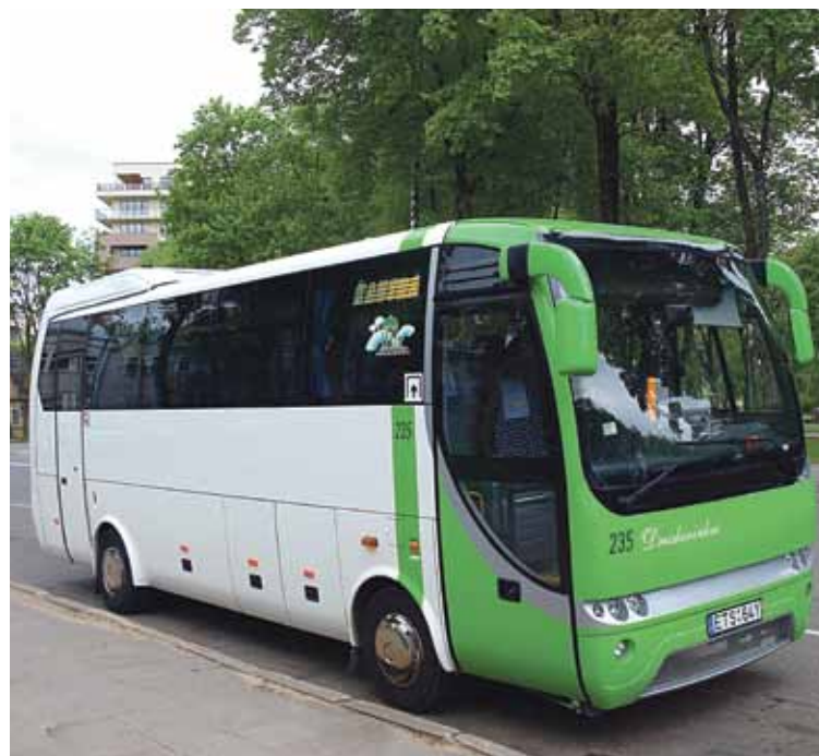
Nuo birželio 8 dienos viešasis transportas Druskininkų savivaldybėje važiuoja pagal savaitgalio tvarkaraštį, galiojusį iki karantino

Informuojame, kad nuo birželio 8 dienos viešasis transportas Druskininkų savivaldybėje važiuoja pagal savaitgalio tvarkaraštį, galiojusį iki karantino.