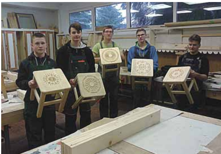
Šiais metais staliaus-dailidės specialybę gali rinktis asmenys, pabaigę 10 klasių, ir įgyti dvigubą kvalifikaciją

Automobilių elektros įrengimų remontininkas naudojami automobilių techninės priežiūros technologine įranga ir įrankiais, elektrinių parametru matavimo įranga, elektroninių valdymo sistemų diagnostine įranga, šaltkalvio įrankiais, moka dirbti mažaisiais mechanizmais (gręžimo, metalo pjovimo, šlifavimo, galandinimo, presavimo ir kita įranga), litavimo įranga.