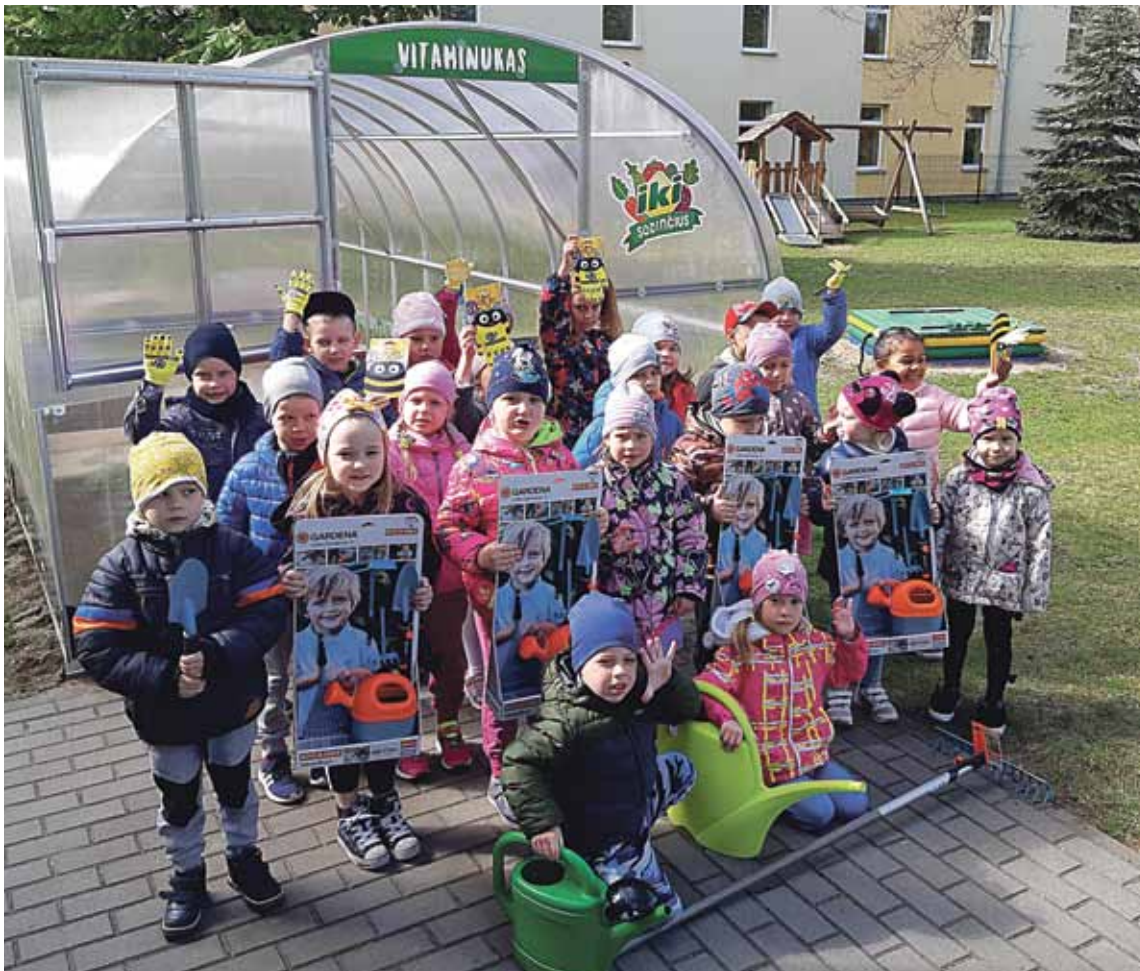
Leipalingio progimnazijos ikimokyklinio ugdymo skyriaus „Liepaitė“ kiemą pasiekė didžiulis šiltnamis, kurį vaikai pavadino „Vitaminuku“