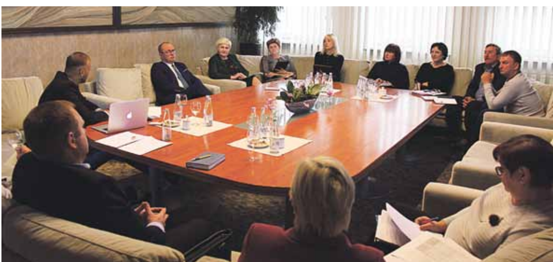
Pasitarime diskutuota apie UAB „Druskininkų butų ūkis“ viešųjų paslaugų kokybę, galimybes optimizuoti ir tobulinti veiklą, pasitelkiant šiuolaikines technologijas bei pažangią metodiką

Susitikime buvo aptarti gyventojų įsiskolinimų, darbuo-