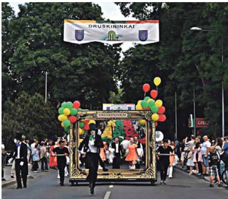
Tikimasi, jog eisenos dalyviai pasitelks vaizduotę ir pavers ją nepakartojamu reginiu, kaip ir kasmet prikaustančiu gausybės žiūrovų žvilgsnius

senos organizuojamas gegužės 2 d., 10 val. adresu: Vasario 16-osios g. 7, didžiojoje salėje (II aukštas).