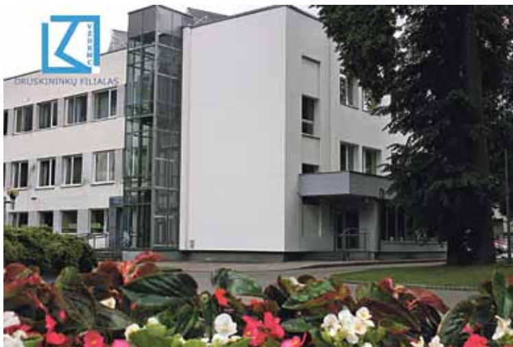
Vienintelė mokymo įstaiga Druskininkų mieste, teikianti pirminio profesinio mokymo paslaugas, yra Vilniaus Žirmūnų darbo rinkos mokymo centro (VŽDRMC) Druskininkų filialas

dirbti smulkiuose ir vidutinėse svetingumo paslaugų įmonėse, teikiančiose individualaus apgyvendinimo paslaugas (nedideliuose viešbučiuose, svečių namuose, užieigose, pensionuose, nakvynės ir pusryčių namuose, kaimo turizmo sodybose, stovyklavietėse ir kita), taip pat užsiimti kita šios srities ūkine veikla, reglamentuota LR įstatymais.