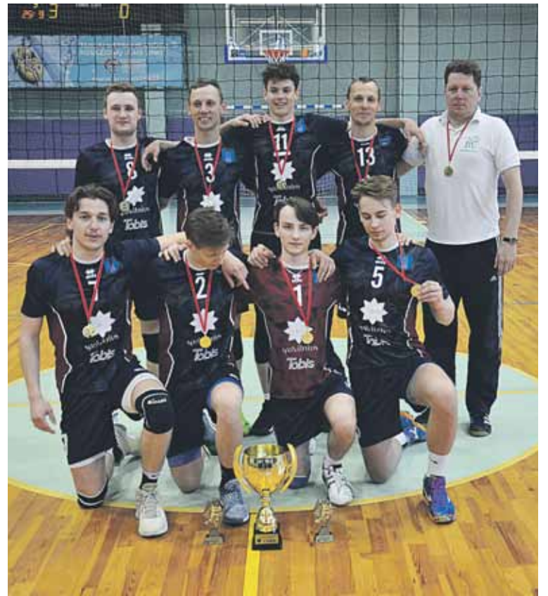
Pirmąją vietą iškovojo komanda „Drusportus“, kuriai atstovavo esami ir buvę Druskininkų sporto centro auklėtiniai

Praėjusį šeštadienį, pasibaigę 2019 metų Druskininkų savivaldybės tinklinio čempionatas, kuriame dalyvavo 4 druskininkiečių komandos: „Leipas“, „Belorus“, „Planas“ ir „Drusportus“. Šios komandos dviejų ratų sistema daugiau nei mėnesį varžėsi dėl Druskininkų savivaldybės tinklinio čempiono titulo.