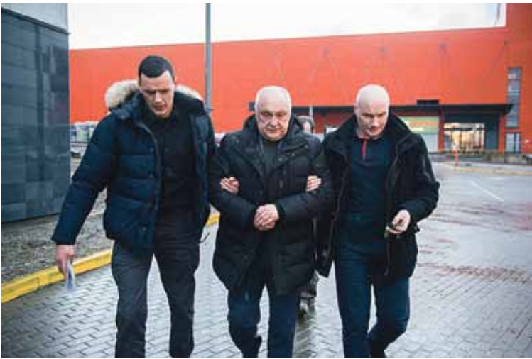
Prokuroras papiktino, kad garbaus amžiaus teisininkai buvo vedami kaip pavojingi recidyvistai, o teisme laisvai vaikštinėjo kontrabandininkas