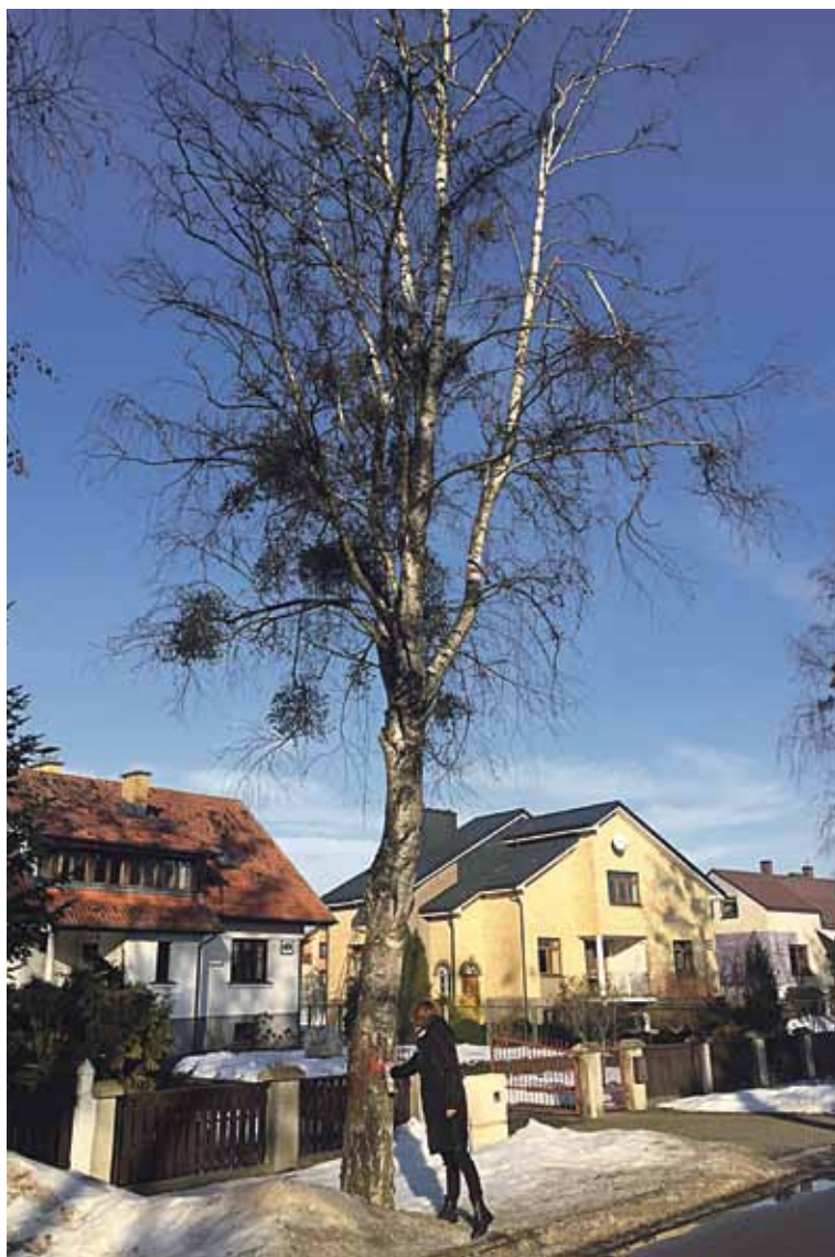
Želdynų priežiūra ir tvarkymui Druskininkų savivaldybėje skiriamas ypatingas dėmesys

Želdynams Druskininkų savivaldybėje tenka svarbus vaidmuo,