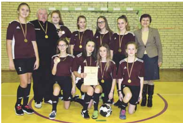
Alytuje organizuotose zoninėse futbolo varžybose „Saulės“ pagrindinės mokyklos futbolininkės sutriuškino visas varžoves

„Saulės“ pagrindinės mokyklos informacija