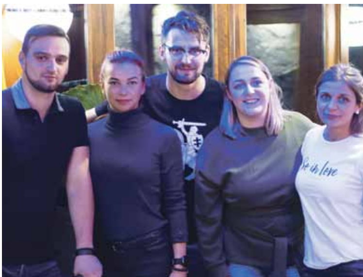
Druskininkų jaunimo komanda -Tarptautiniuose jaunimo mainuose Makedonijoje/Druskininkų jaunimo užimtumo centro/Druskininkų JUC archyvo nuotrauka