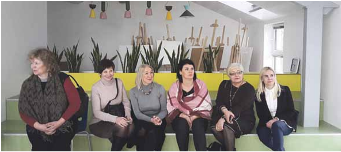
Kauno Panemunės pradinėje mokykloje apsilankę „Atgimimo“ mokyklos mokytojos pasisėmė įdomių patirčių

Susidomėję Kauno Panemunės pradinės mokyklos veikla, šios mokyklos mokytojų pranešimais seminaruose, įdomiai išspęsta patalpų didinimo problema, pastatant trečiąjį mokyklos aukštą, lapkričio 29 d. didelė grupė „Atgimimo“ mokyklos pradinė klasių mokyto-