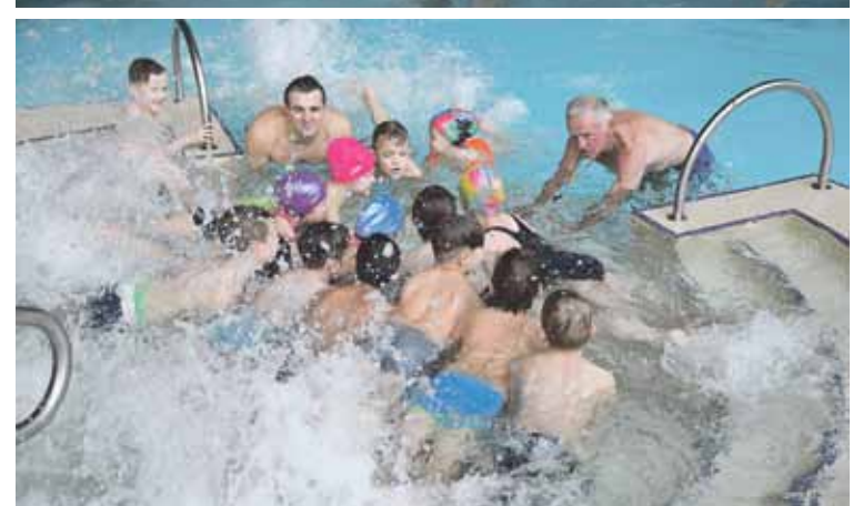
Druskininkų vandens parke baseine mokiniai buvo mokomi plaukti, susipažino su saugaus elgesio vandenyje taisyklėmis, mokėsi įvertinti savo fizines galimybes konkrečiose situacijose