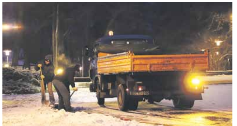
Druskininkų savivaldybės vadovų, administracijos specialistų ir už tvarką atsakingų UAB „Druskininkų komunalinis ūkis“ bei Paslaugų ūkio atstovų susitikime akcentuota, kad aplinkos, kelių ir šaligatvių priežiūros darbai turi būti atliekami labai operatyviai, laiku, nesudarant nepatogumų bendruomenei

2-3 psl. Druskininkų savivaldybės informacija