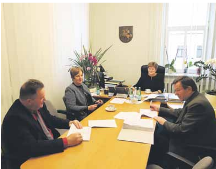
Druskininkų savivaldybės žemės ūkio rėmimo programos projektų vertinimo ir atrankos komisija, išnagrinėjusi pateiktas paraiškas, priėmė sprendimą suteikti finansinę paramą net 38 projektams

Praėjusią savaitę Druskininkų savivaldybės žemės ūkio rėmimo programos projektų vertinimo ir atrankos komisija, išnagrinėjusi pateiktas paraiškas, priėmė sprendimą suteikti finansinę paramą net 38 projektams. Dažniausi Druskininkų krašto ūkininkų pateiktų projektų tikslai – investicijos į ūkių modernizavimą ir automatizavimą, prevencinės priemonės, apsisaugant nuo laukinių gyvūnų daromos žalos, priemonės, padedančios užtikrinti biologinės saugos reikalavimus ūkiuose, ir kitos. Minėtas projektų sąrašas ir projektams skirtos lėšos šią savaitę patvirtintos savivaldybės administracijos direktoriaus įsakymu.