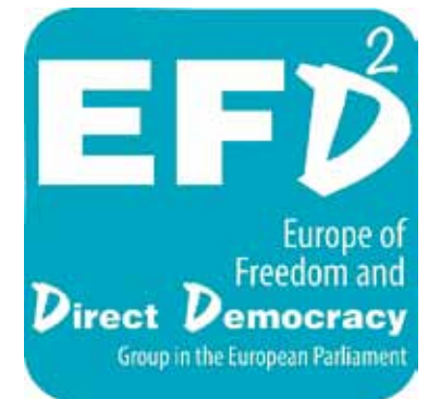
Parengta bendradarbiaujant su Europos Parlamento frakcija „Laisvės ir tiesioginės demokratijos Europa“

Tad visiems linkiu gražių besibaigiančių metų, šviesių ir jaukių Šv. Kalėdų, gražios pradžios naujais, 2019 metais. Tegu jie būna be kiaulysčių, nors pagal Rytų kalendorių bus vadinami Kiaulės metais.