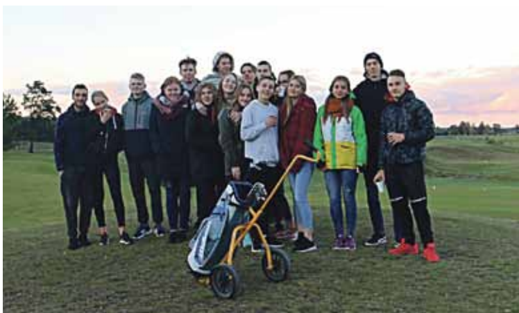
Mobilus darbas su jaunimu