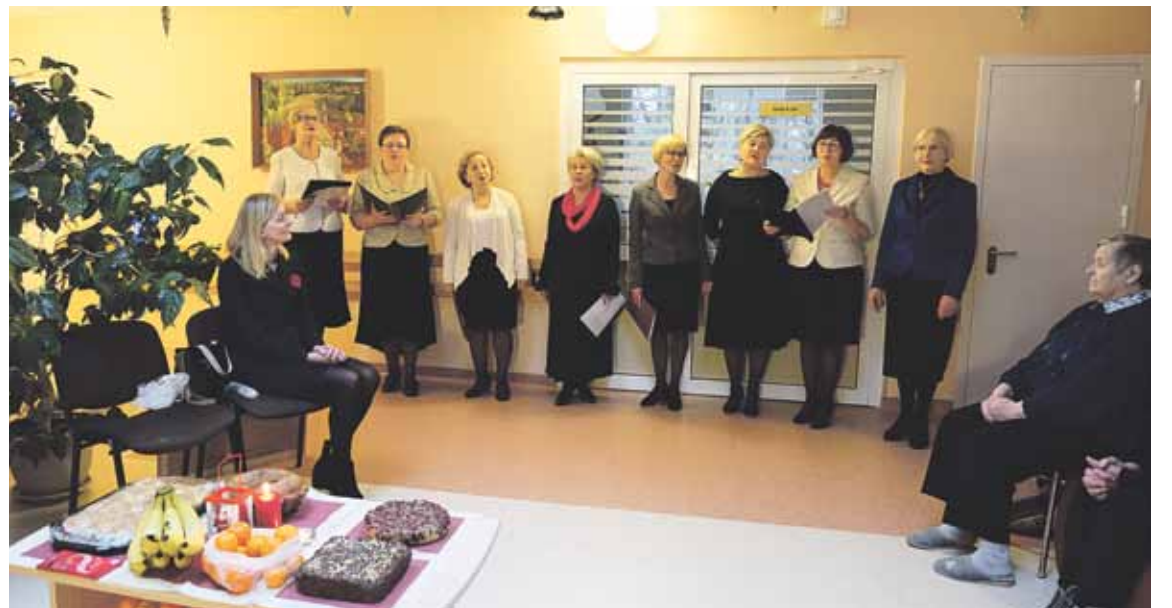
Slaugomus senolius aplankė moterų sakralinės muzikos ansamblis