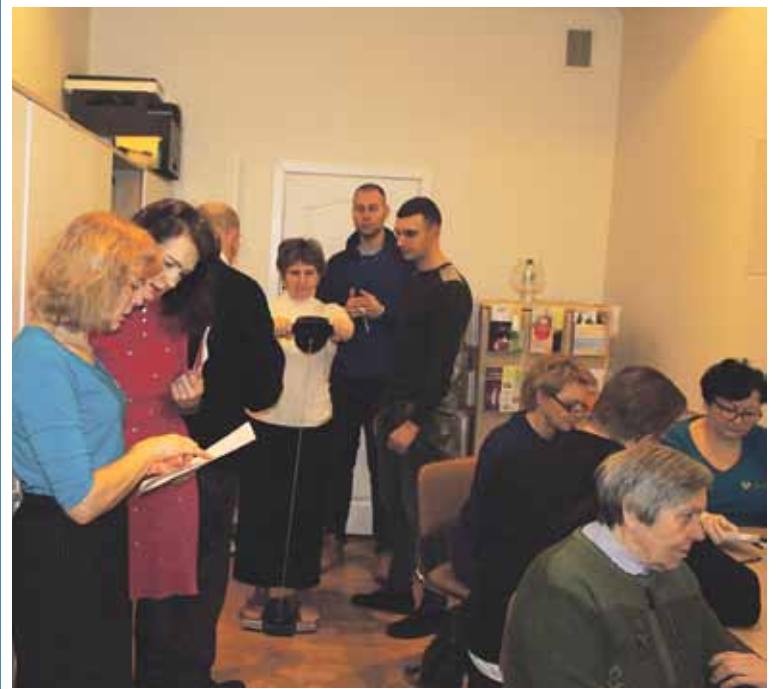
Atvykusieji į Druskininkų savivaldybės VSB galėjo pasimatuoti arterinį kraujo spaudimą, pasidaryti gliukozės ir cholesterolio kiekio kraujyje tyrimą

Artėjančių švenčių belaukiant, Druskininkų krašto gyventojai turėjo galimybę pasirūpinti savo sveikata. Druskininkų savivaldybės visuomenės sveikatos biuras (VSB) kartu su diabeto klubu „Atgaja“ gruodžio 17 d. organizavo Atvirų durų dieną. Atvykusieji į Druskininkų savivaldybės VSB galėjo pasimatuoti arterinį kraujo spaudimą, pasidaryti gliukozės ir cholesterolio kiekio kraujyje tyrimą. Taip pat visuomenės sveikatos specialistai vi-