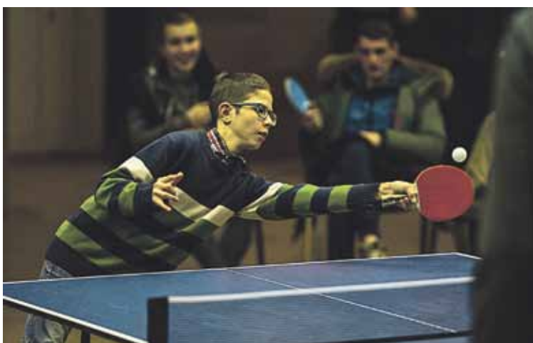
Stalo teniso turnyras