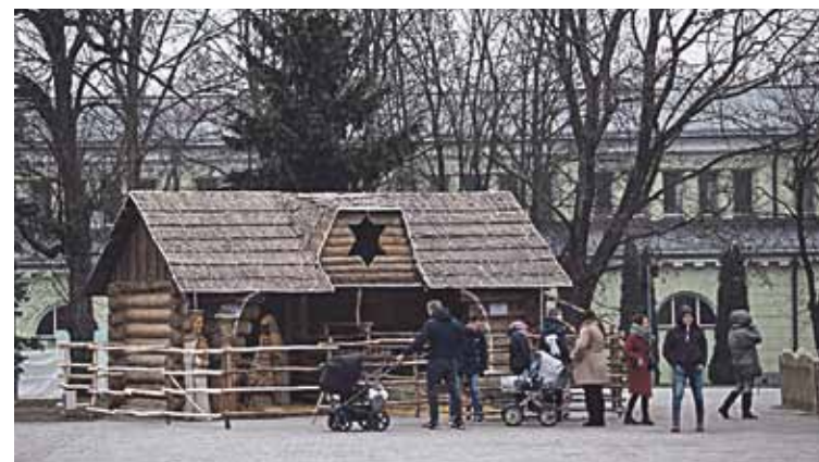
Ir aplankytame Niurnbergo mieste, ir, turimomis žiniomis, Leipcige, kaip ir Druskininkuose, įrengtos europiečių mėgstamos ir giriamos prakartėlės su gyvais gyvūnais