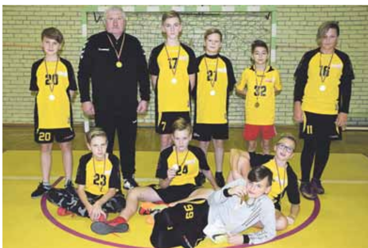
Jaunesni „Saulės“ futbolininkai pateko į Lietuvos olimpinio festivalio komandų tarpzonines varžybas