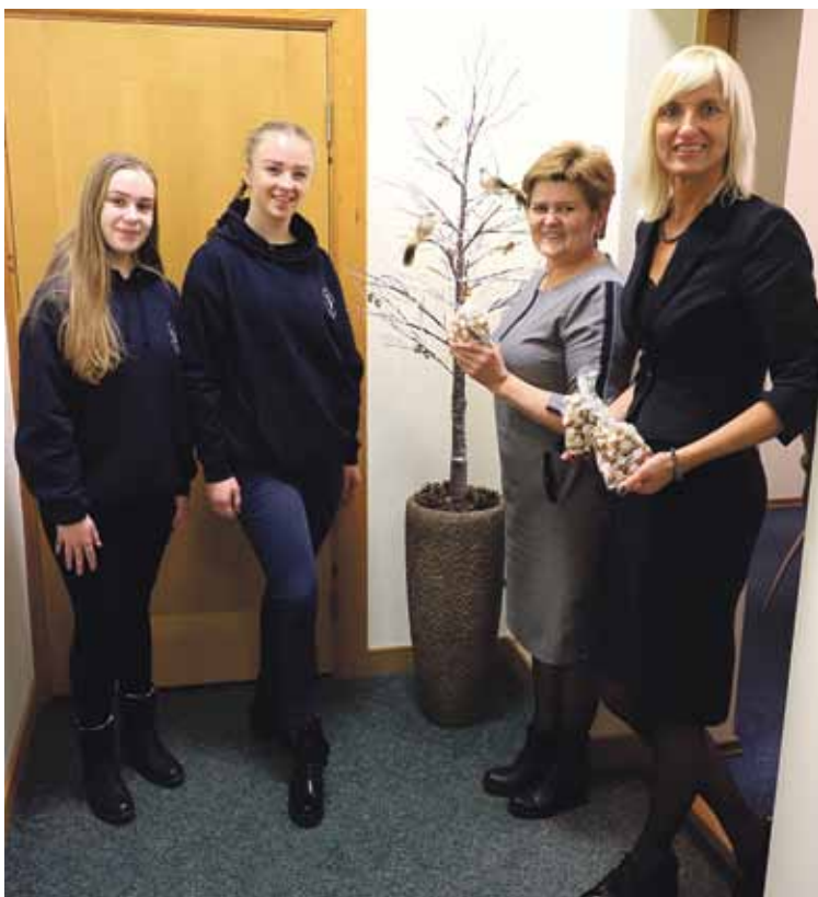
Moksleiviai ir Savivaldybės vadovus pakvietė įsigyti saldžių kepinų ir taip prisidėti prie kilnaus tikslo – praskaidrinti šventes vienišiams seneliams

Praejusį ketvirtadienį Druskininkų savivaldybėje ir kitose įstaigose apsilankė „Ryto“ gimnazijos moksleiviai, nešini daugiau kaip 200 savo rankomis gamintų saldžių dovanėlių. Moksleiviai kvietė įsigyti saldžių kepinų ir taip prisidėti prie kilnaus tikslo – praskaidrinti šventes vienišiams seneliams. Prie meduolių kepimo ir dovanų pakavimo kasmet prisideda gimnazijos bendruomenė. Visi surinkti pinigai bus skirti vienišiams Druskininkų savivaldybės seneliams – juos moksleiviai aplankys po Trijų Karalių šventės.