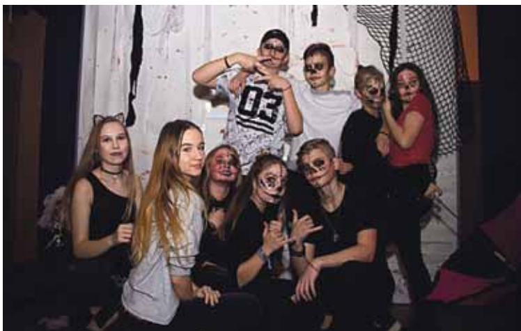
Jaunimui organizuota diskoteka

Druskininkų jaunimo užimtumo centro informacija