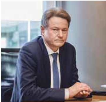
Rolandas PAKSAS, Europos Parlamento frakcijos „Laisvės ir tiesioginės demokra- tijos Europa“ vicepirmininkas