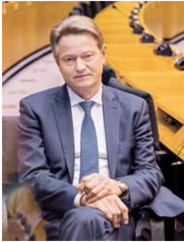
Rolandas PAKSAS, Europos Parlamento frakcijos „Laisvės ir tiesioginės demokratijos Europa“ vicepirmininkas