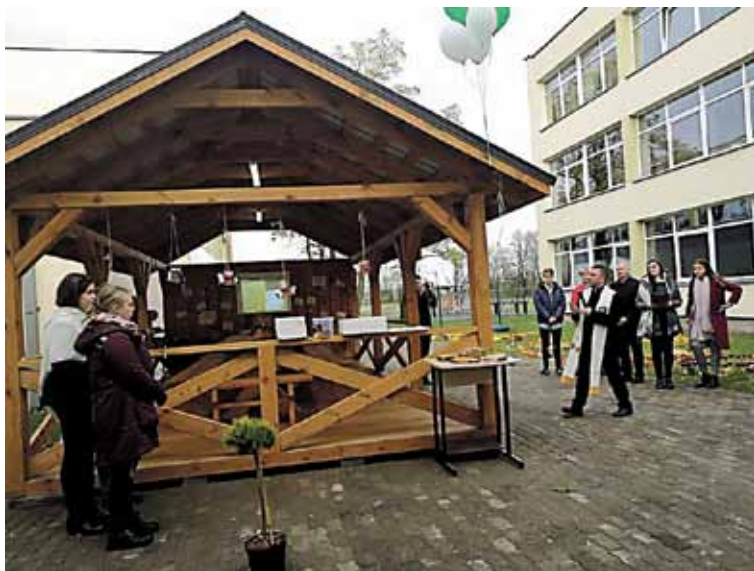
Renovuotame kiemelyje pastatyta funkcionali medinė pavėsinė, šiltuoju metų laiku tapsianti vieta ir poilsiui pertraukų metu, ir pamokų vedimui – „žaliąja lauko klase“.

Kol vieni mokiniai dėliojo koliažus, kiti lankėsi ir darbavosi įvai-