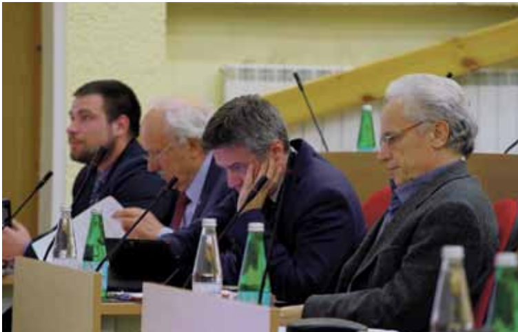
Įdomu, kaip liberalai ir konservatoriai supranta konstruktyvų darbą Taryboje?

Posėdyje konservatorius V. Semeška, savo pasisakyme perėjęs į vieno savo partijos vedlio „kas galėtų paneigti!“ retoriką, reišė nepasitenkinimą, kodėl taip rūpi-