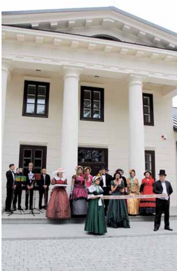
2015 m. duris atvėrė atnaujinta Leipalingio dvaro dalis. Gavus ES finansavimą, iki 2020 metų planuojama rekonstruoti ir antrąją dvaro dalį

Kitas Druskininkų savivaldybės administracijos projektas – Dienos centro senyvo amžiaus asmenims ir neįgaliesiems įrengimas nenaudojamos Liginės patalpose (Sveikatos g. 30, Druskininkai). Dienos centre planuojama teikti savivaldybės bendruomenei ir kurorto svečiams aktualias paslaugas. Šiomis paslaugomis galės pasinaudoti neįgaliųjų tėvai ar globėjai bei senjorus prižiūrintys artimieji, keletą valandų negalintys pasirūpinti