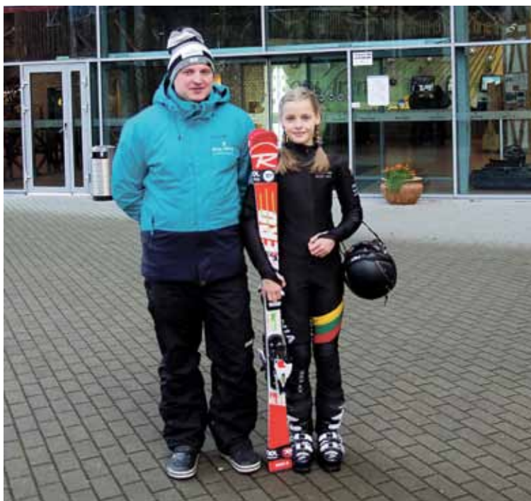
Liepa labai dėkinga savo pirmajam treneriui A. Bikulč, kuris sudomino šia sporto šaka