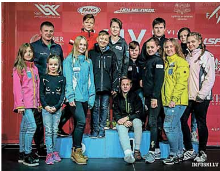
Perspektyviausi jaunieji druskininkiečiai, treniruojami profesionalaus trenerio A. Bikulč, dalyvavo Baltijos taurės pirmojo etapo varžybose

tyje atstovautų Druskininkams, Lietuvai tarptautinėse varžybose, čempionatuose, olimpiadose. Druskininkuose turime profesionalią žiemos sporto bazę, patyrusius trenerius – būtina išnaudoti šį pranašumą. Tačiau žiemos sportas yra vienas brangesnių, tikrai suprantame, kad yra situacijų, kai labai gabių vaikų tėvai neišgalėtų investuoti į sportui reikalingas priemones, tokias kaip apranga, batai, slidės, todėl svarstysime visas galimybes, kaip padėti tokiems žiemos sporto aukštumų siekiantiems jauniems druskininkiečiams.“