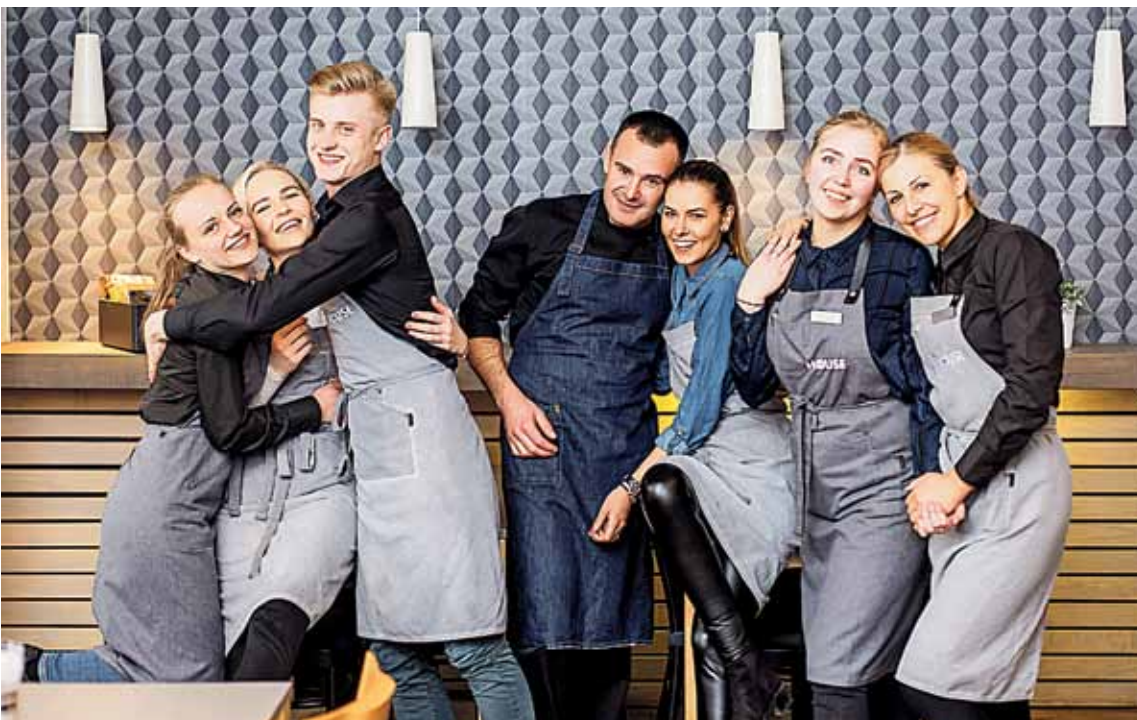
Draugiška „The House“ personalo komanda ir lankytojams negaili šypsenu.