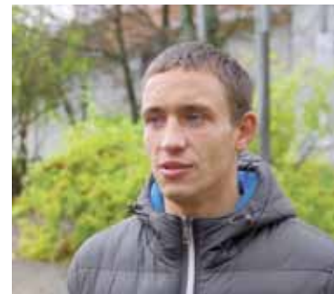
Eimantas (Druskininkai): „Manau, kad pati populiariausia vieta Druskininkuose yra miesto, senamiesčio centras – prie Gydyklų fontano. Čia labai populiarūs ir graži vieta susitikimams. Ir svečiams, ir vietiniams K. Dineikos sveikatinamo parkas po rekonstrukcijos tapo viena gražiausių vietų Druskininkuose, kurioje smagu pasivaikščioti. Verta dažniau praeiti ir tiesiog Nemuno krantine – šie pasivaikščiojimai nuteikia romantiškai ir maloniai.“

fontanas, mėgstu pasivaikščioti būtent prie fontano. Parkai, ramybė, važinėjuosi dviračiu, lankausi Vandens parke. Mieste ir aplinkui daugybė gražių vietų maloniam pasivaikščiojimui. Man mieliausia pasivaikščioti prie Druskonio ežero, ten netoliese esančiame viešbutyje šį kartą ir apsigyvenau. Druskininkuose gera ilsėtis bet kuriuo metų laiku, čia visada gali atsipalaiduoti ir rasti sau tinkamų paslaugų ar pramogų. Druskininkuose gera jausti vienovę ir harmoniją su gamta. Nesigailiu, kad šįkart poilsiauju čia rudenį.“