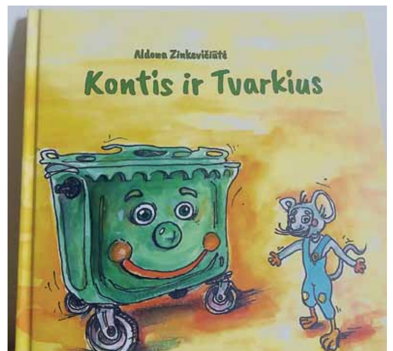
Regiono bibliotekoms Alytaus regiono atliekų tvarkymo centras padovanojo beveik 800 knygų egzempliorių

Alytaus regiono atliekų tvarkymo centro informacija