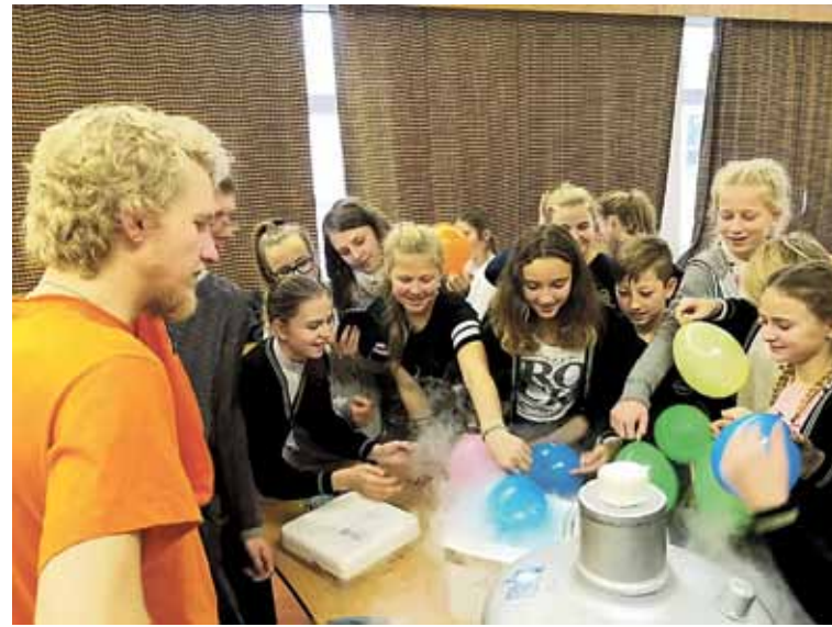
Jaunųjų mokslininkų grupelė „Oranžiniai“ demonstravo įvairius bandymus.

vickienė savo mokslinėse laboratorijose priėmė ir ketvirtokus, ir vyresniųjų klasių mokinius – eksperimentuotojai galėjo ne tik mėgintuvėlius pačiupinėti, pilstyti, uostyti, bet įdomiasias šarminių ir rūgštinių medžiagų reakcijas stebėti. Būtent aktyvia praktine tyrimine veikla savo pamokas praturtino ir jaunųjų mokslininkų grupelė „Oranžiniai“, kurie, pasidaliję į tris grupes, demonstravo mokiniams įvairius bandymus: regėtus ir nežinomus, spalvotus ir labai nekvapnius, bet užvis įdomiausia vaikams buvo pažintis su skystuoju azotu, sauso ledo ypatumais.