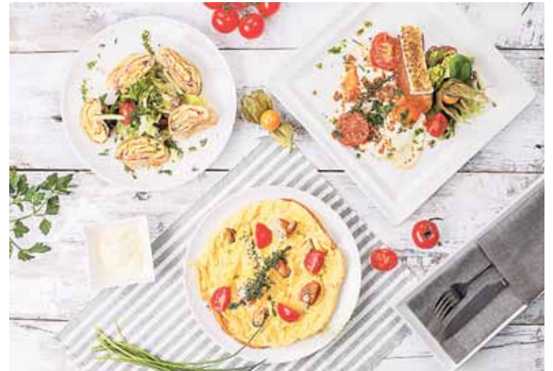
„The House“ sekmadieniais kviečia skanius, estetiškai patiektus vėlyvųjų ilgųjų pusryčius.