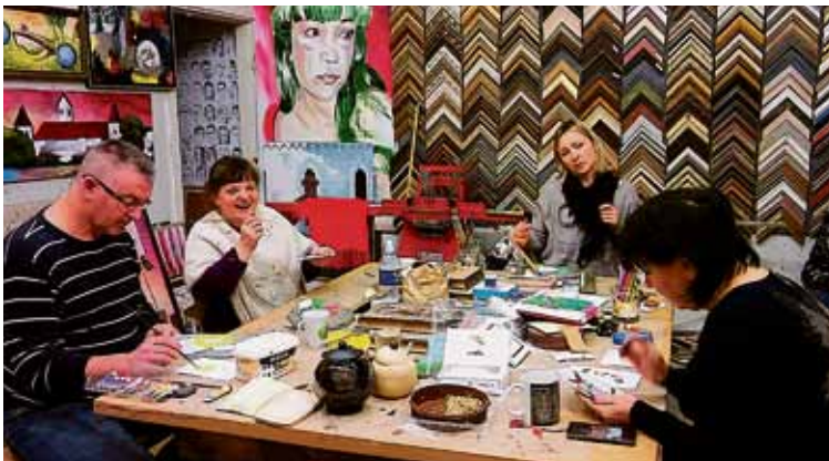
Suaugusiųjų mokymosi ir švietimo savaitės renginiai vyko įvairiose erdvėse

nę ir gyvenimišką patirtį turinčių druskininkiečių susitikimai buvo visokeriopa naudingi: nauja patirtis, žinios, bendravimas, geros emocijos.“