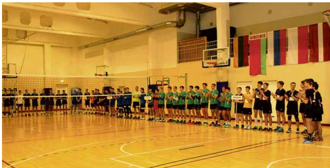
Į XI-ąjį tinklinio turnyrą UAB „Tobis“ Taurei laimėti susirinko jaunieji tinklininkai iš Baltarusijos, Latvijos, Lenkijos, Kaliningrado, o Lietuvai atstovavo Druskininkų Sporto centro komanda