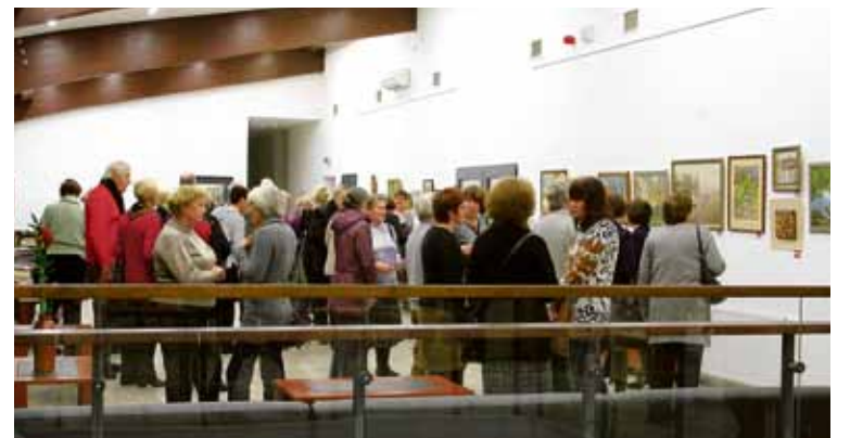
Viešosios bibliotekos erdvėse atidaryta dailininko, menotyrininko, Druskininkų garbės piliečio A. Nedzelskio tapybos darbų paroda „Vasaros paveiksliukai“