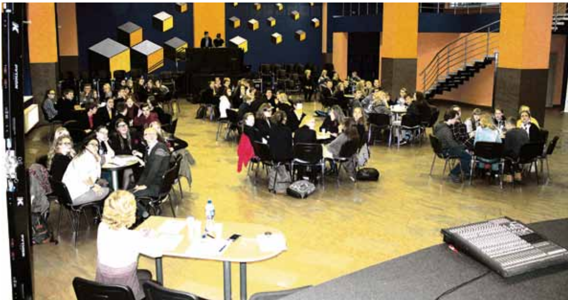
Renginyje dalyvavo 10 komandų iš skirtingų ugdymo įstaigų

Pasaulio sveikatos organizacijos duomenimis, nuo rūkymo sukeltų ligų pasaulyje kasmet miršta apie 5 milijonus žmonių. Rūkymas išlieka viena svarbiausių Europos regiono žmonių mirties priežasčių. Lietuvoje rūkymas taip pat yra plačiai paplitęs. Tabako gaminių vartojimas turi įtakos mirtingumui nuo lėtinių susirgimų – širdies ir kraujagyslių, lėtinių kvėpavimo takų ligų, vėžio, diabeto ir kitų. Tabako dūmuose yra daug nuodingų medžiagų, kurios kenkia sveikatai. Tai nikotinas, alkaloidai, fenolai, kancerogeninės medžiagos (dažnai bendrai vadinamos dervomis) – acetonas, amoniakas, anglies monoksidas, cianidas, metanas, propanas, butanas ir kitos. Nikotinas yra pagrindinė cigarečių medžiaga, turinti neigiamą poveikį organizmui. Jis patenka į smegenis per 10 sekundžių po to, kai pradeda rūkyti. Nepratusiam rūkyti didelės nikotino dozės gali sukelti pykinimą, prakaitavimą, drebulį ar net traukulius. Nikotinas skatina kraujotaką, todėl didina trombozės riziką. Susidarę krešuliai gali patekti į širdį ar smegenis ir sukelti infarktą ar insultą. Trom-