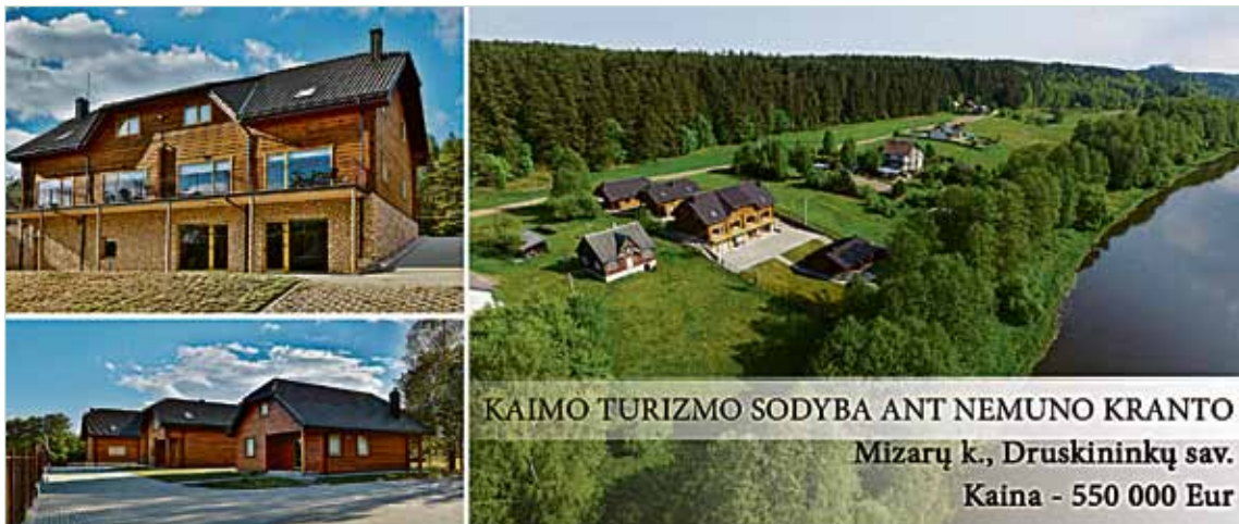
KAIMO TURIZMO SODYBA ANT NEMUNO KRANTO Mizarų k., Druskininkų sav. Kaina - 550 000 Eur

mybės. Piešdami, vaikai lavina orientavimosi erdvėje įgūdžius, smulkiąją motoriką, skatina vaizduotę, kūrybiškumą. Džiugu, kad lopšelyje darželyje „Žibutė“ skiriamas dėmesys visapusiškai vaikų saviraiškai.