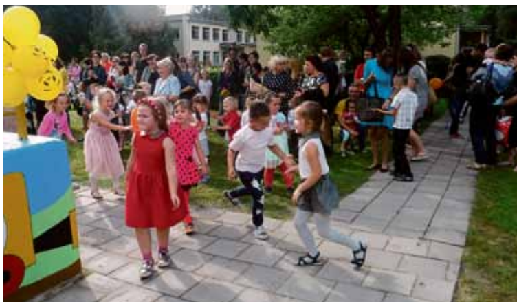
Tėveliai džiaugiasi, kad lopšelyje-darželyje „Žibutė“ vaikučiams augti smagu, įdomu ir gera

bina, kai aš ateinu ryte“ (Jokūbas, 5 m.); „Man patinka, kai Irena mus vadina katinukais“ (Ričardas, 5 m.); „Man patinka, kai mane kas nors nudžiaugsmina“ (Aironas, 5 m.); „Patinka auklėtojos, nes jos labai geros ir mylimos“ (Artautė, 5 m.); „Patinka darželyje dirbti, nešti valgyti, dengti stalą“ (Liepa, 5 m.); „Mane daro laimingu įdomūs žaidimai ir draugystė su Dominyku“ (Arijus, 5 m.).