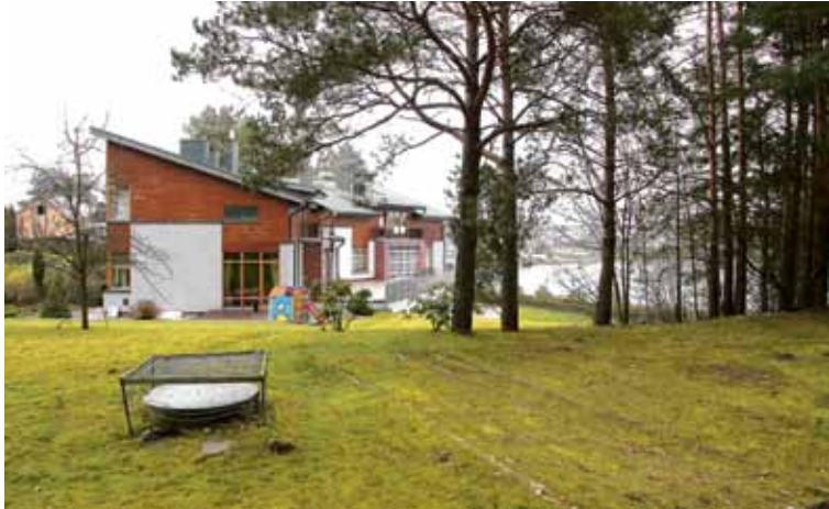
Valstybės žemėje atsirado laiptai, atraminės sienos, augalai ir net suskystintųjų dujų saugojimo rezervuaras

Dvi druskininkiečių šeimos gali džiūgauti. Nors jos jau seniai savo valdas išplėtė maždaug dešimties arų valstybės žemės sklypu itin vaizdingoje kurorto vietovėje, teismams ir prokurorams kažkodėl tai pasirodė visiškai normalus dalykas.