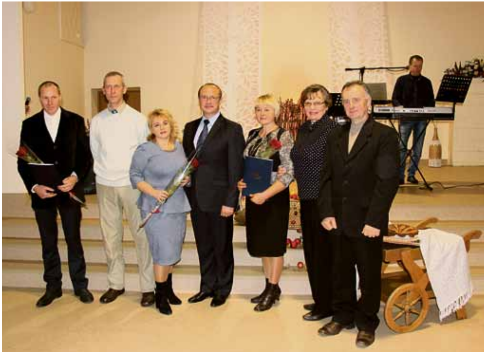
Šventėje apdovanoti konkurso „Metų ūkis 2016“ nugalėtojai