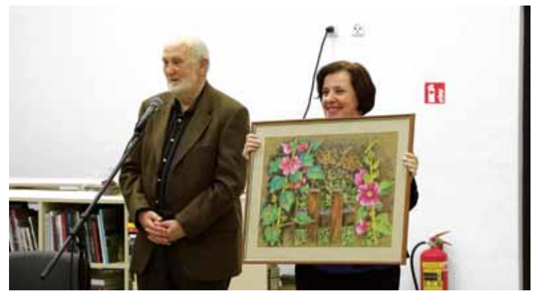
A. Nedzelskis Viešąją bibliotekai padovanojo savo tapybos darbą

Druskininkų viešosios bibliotekos informacija